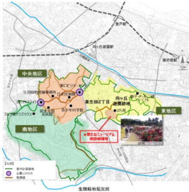
■「生田緑地ばら苑隣接区域」位置図

※ 位置図中の楕円の点線は、開設候補地のおおその位置を示したものであり、詳細な範囲は今後検討。