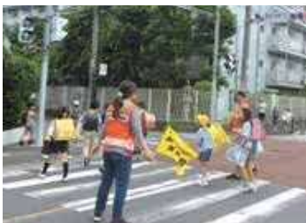
通学路の見守り(菅第2地区)