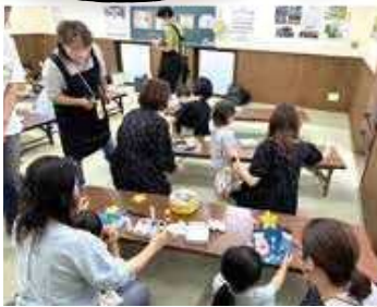
子育てサロン(生田東地区)

民生委員児童委員は、ボランティアとして市民の暮らしを見守り、生活のことで悩みを抱えている方を、必要な支援につなげる役割を担っています。