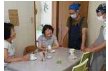
地域カフェ(生田第2地区)

また、子どもや子育て中の方、高齢者への支援として、見守り活動や交流活動などを行い、安心して暮らすことのできる地域づくりに取り組んでいます。