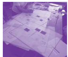
実際に図面を描いて考えます

に気をつけるべきこと、建物調査の仕方などを学びました。 そしていよいよグループワーク開始。1時間以上じっくり話し合い、実際に図面にプランを書き込みました。 後半はグループごとに発表をして、感想を言い合い、建築士のみなさんからプランを実現するためのアドバイス、建築を取り巻く環境やルール、建築の仕事に関する説明等を受けて充実した時間を過ごせました!