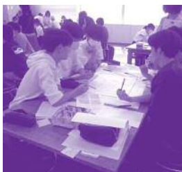
話し合う時は、みんな真剣そのものです

8月23日(水) 13:00～16:30、中高生を対象にした建築講座を開催しました。 当日は28人の中高生が参加し、建築士のみなさんと大学生サポーターの指導の下、グループに分かれて高津区を舞台にした空き家のリノベーションプランを立てました。 講座の前半は、高津区のマップに「気になるところ」「行ったことのあるところ」などを書いた旗を立て、みんなで情報を共有しました。 その後は、建築士のみなさんによるレクチャー時間です。リノベーションへの理解、プランを立てる時