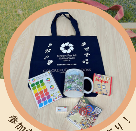
参加者にはプレゼントあり！