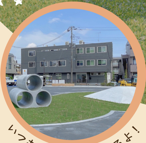
いつもの公園でまってるよ！