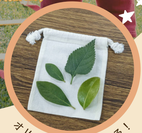
オリジナル巾着が作れる！