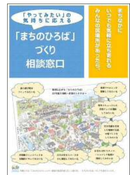
相談窓口のチラシ