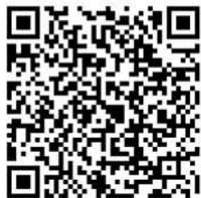
川崎市総合自治会館