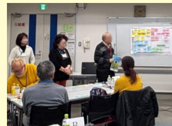
グループごとの発表の様子

令和7年12月19日(金)、高津市民館をいつもご利用いただいている皆様と一緒に、これからの高津市民館を考える『ファンミーティング』を開催しました。