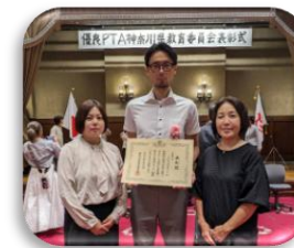
下作延小学校PTAの方々

【橘小学校PTA会長】このような素晴らしい賞を頂き、大変光栄に存じます。日頃よりご支援くださっている本部役員を始め保護者の皆さま、OB会の皆さま、そして地域の皆さまに、心より御礼申し上げます。今後も皆で力を合わせ、子どもたちの健やかな成長に少しでも貢献できましたら幸いです。