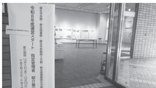
麻生市民館での紹介展示