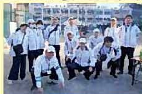
●南河原地区町連大運動会 町会長・スポーツ推進委員と 協力して行いました！