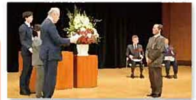
令和 8年 2月22日 表彰式@県立音楽堂

このたびは表彰を賜り、心より御礼申し上げます。青少年指導員の一員として活動を始めて、はや18年が経ちました。その間、色々なイベントや夜間パトロールを通じて、良き諸先輩や仲間、そして町内会をはじめ、様々なボランティア活動団体の皆様方との暖かい交流をする事が出来、大変楽しく、有意義な経験をさせていただいています。宿泊研修では近隣の少年院や防災センターなどを見学させて頂き、これも大変貴重な経験となりました。子ども達とふれあう機会が多いのですが、みんな素直で良い子たちばかりです。これからも幸区の子供達元気にすくすくと育っていくことを心より願っています。