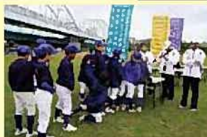
●御幸ウォークラリー大会 今年もたくさんの方が参加し 盛り上がりました！