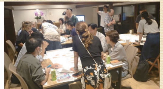
「まちづくりカフェたかつ」の様子

「まちづくりカフェたかつ」で仲間づくり、「高津大山街道あす LABO」で実践の場をつくることなどで「まちのひろば」支援をしています。また、高津スポーツセンター内に地域活動に関する相談窓口を開設し、地域活動を始めたい地域住民や団体の入口として、相談対応、マッチング、情報発信を実施しています。