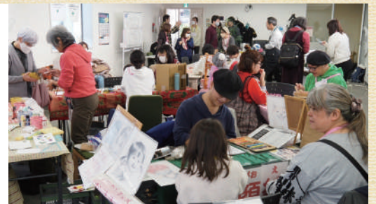
「みやまえ BASE」交流型イベントの様子

区内の様々な人や団体がつながる場である「みやまえ BASE」では、年に3回程度交流型イベントを開催し、宮前区の話や各回のテーマに関連する話を紹介するみやまえキャンパスのほか、参加者同士の交流会などを実施しています。