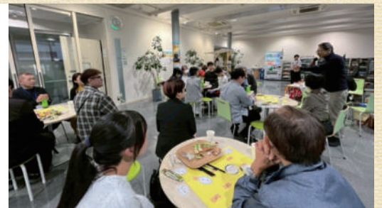
「あさおドリームミーティング」の様子

住民同士が気軽に交流・相談できる場づくりを行う「おしゃべりひろば」や、地域住民や団体が交流できるイベント「まちのひろば祭り」、地域で活躍する人の話を聞く「あさおドリームミーティング（旧麻生区100人カイギ）」の開催など、地域コミュニティの活性化に向けて取り組んでいます。