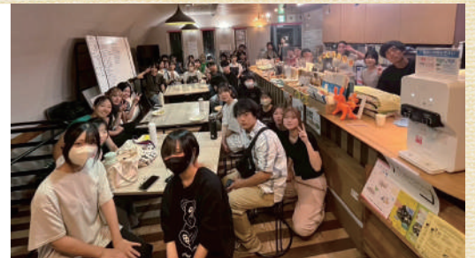
子ども食堂の打合せの様子

「登戸・たまがわマルシェ」や「子ども食堂開催支援」などを通して、まちのひろば創出や人と人を結ぶ活動を実践しています。また、多世代の参加者が交流する「カラフルカフェ」等の各種カフェの開催を通じた居場所づくりや交流の場づくりにも取り組んでいます。