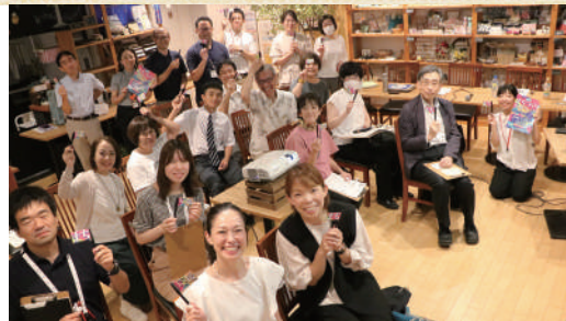
「応援フォーラム」の様子

「まちのおと」は新川崎タウンカフェ内にある、地域活動の支援拠点です。活動に関する個別相談のほか、交流会やフォーラムを定期開催しています。市民が地域とつながる場として、幸区の豊かなまちづくりを応援しています。