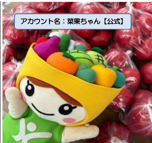
アカウント名：菜果ちゃん【公式】

かわさきそだちPRキャラクター「菜果ちゃん」が、かわさきで愛情いっぱい育てられた農畜産物の魅力や地産地消に関する情報を紹介していくアカウントです♪ 今年度は、季節に応じ、農家さんの農業秘話やかわさきそだちを使っているレストラン等の情報もご紹介していきます。ぜひ、フォローしてくださいね！