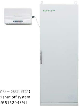
がんばってりー【特許取得】 AOS : Anti shut off system (特許登録第5162043号)

わたしたちが考えたのは、 不安定な日照条件下でもライフラインを止めない、 エネルギーのマネージメントシステム*。