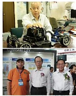
▲福田元首相と阿部川崎市長と記念撮影

スケールスポーツは、時速60キロという大迫力の操作が楽しめますが、すべての人に楽しんでもらえるように、車体の改造はできません。お金をかけずに、初心者の方からベテランの方まで、テクニックの違いだけで楽しめるようにしています。燃料も混合ガソリンではなく、普通のガソリン。1リットルあたり80kmくらい走り、1リットルのガソリンで2時間くらいは遊べる計算です。月に一度程度のイベントを当社が主催し、誰でも楽しめるモータースポーツの普及に取り組んでいます。川崎市の「川崎ものづくりブランド」にも認定され、各方面で紹介いただく機会を得て、現在では中国をはじめとして多くの国からの引き合いが来はじめています。今後も、世界に向けて日本のものづくりの素晴らしさを発信していきたいですね。