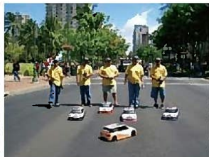
ハワイの299年祭のパレードで行進した様子。