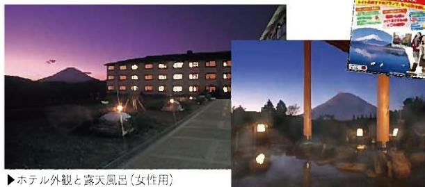
▶ホテル外観と露天風呂(女性用)