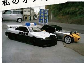
交通安全のキャンペーンでパトカーとコラボ。車体のペインティングも自らが行う。