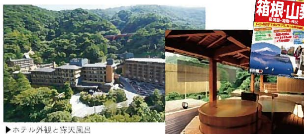
▶ホテル外観と露天風呂