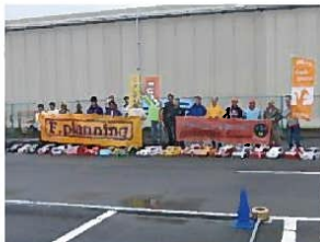
定期的に行われるスケールスポーツのイベントにて。

休日にもイベントの対応や、車体のペインティングに時間を費やしています。ものづくりは魂を込めないとできません。一度で良いものはできませんし、何年もかけて、アイデア・工法などを積み重ね完成するのだと思います。ただし、好きなことを仕事にすると妥協ができなくなり、無理難題であってもなかなか断れません(笑)。最近では冗談で「お金儲けをしようと思ったら、嫌いなことを仕事にした方が良いか」と言っています。ビジネスとして割り切ってできますからね(笑)。