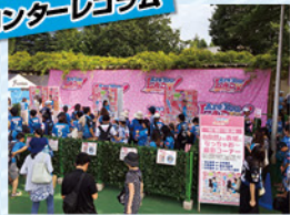
※画像は昨年の「Are You Lady!」のイベント風景です。

2018年はワールドカップ開催のため、J1リーグは5月下旬から7月中旬まで中断期間です。再開1発目の試合は7/22(日)V・ファーレン長崎です。この日は年に一度の川崎市制記念試合。マスコットたちが等々力に大集合します！さらに8/5(日)の横浜F・マリノス戦では女性に特化した一大イベント「Are You Lady!」、8/15(水)サガン鳥栖戦では東急グループ全面協力。道やバスなどロマン溢れる乗り物の魅力に触れられるイベント「川崎の車窓から～東急グループフェスタ～」を開催いたします。