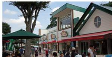
サイボクハム(イメージ)