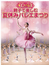
※3歳以下のお子様のご入場はご遠慮ください。 ※演奏は特別録音音源を使用いたします。 ※演目・出演者は変更になる場合がございます。

親子で楽しむ夏休みバレーまつり キエフ・バレエ ータラス・シェフチェンコ記念ウクライナ国立バレエー ①平成30年8月4日(土)14:00 ②平成30年8月5日(日)11:30 東京国際フォーラム ホールC