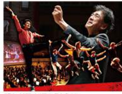
© Takashi Iijima / West Side Story © SSI/Metro-Goldwyn-Mayer Studios Inc. All Rights Reserved. © AMPAS.

奇跡の共演! 佐渡裕指揮のもと全ての演奏者と映画の登場人物が一体となる渾身の「ウエストサイド物語」。映画全編映像に合わせてフルオーケストラ演奏!