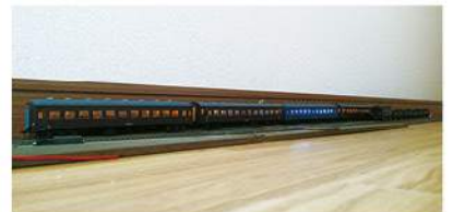
1/80の鉄道模型。通常販売されている模型のレール幅は16.5ミリですが、国鉄の線路幅1,067ミリ÷80=13.33ミリに近くなるよう、13ミリに車輪および線路幅を狭くしてあります。2両目は室内灯を蛍光灯色に変えています。