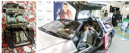
映画「バック・トゥー・ザ・フューチャーII」に登場したデロリアン。2月に中原区のとどろきアリーナで行われた環境技術展にあった実物です。左写真は現在作成中の8分の1スケール。