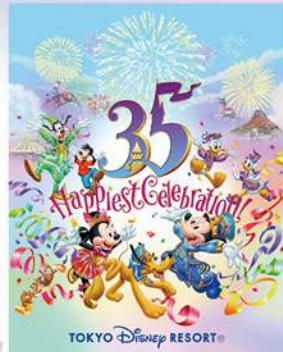
TOKYO DISNEY RESORT®