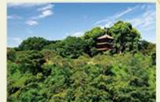
ホテル椿山荘東京庭園(三重塔)

場所 ホテル椿山荘東京 往 東京都文京区関口2-10-8 交 東京メトロ有楽町線「江戸川橋駅」1a出口より徒歩約10分