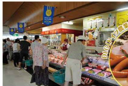
サイボクハム(イメージ)