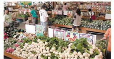
地元野菜直売所楽農ひろば(イメージ)