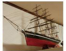
この帆船の全長は1.15m、高さは0.88mあり、自宅の冷蔵庫の上に鎮座しています。