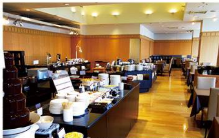
川越プリンスホテルエトワール店内(イメージ)