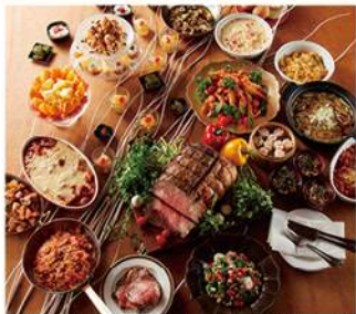
川越プリンスホテルエトワールランチ(イメージ)