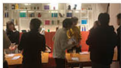
恋活パーティー&川崎工場夜景バスツアー 日時:12月14日(土) イベントや夜景など充実してました。