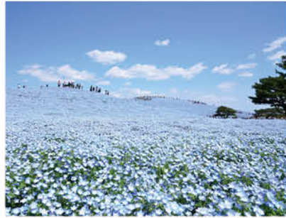
ひたち海浜公園 みはらしの丘(イメージ) 【水戸 印籠弁当(弁当イメージ)】

*地元茨城県産の食材を使った、水戸の黄門様の印籠を重箱にアレンジしたお弁当です。