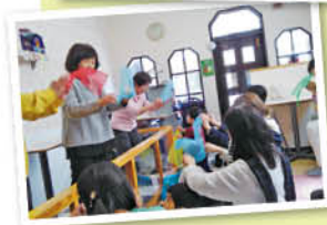
常連さんが初めてきた人にも優しく話しかけるやさしい雰囲気の店内。