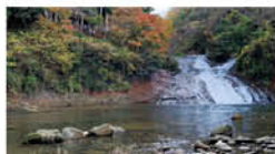
養老渓谷と亀山湖と三井アウトレットパーク木更津 日時:12月1日(日) 流れる水面は迫力がありました。