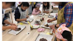
東京ストロベリーパークでイチゴ摘みとお菓子作りをしよう! 日時:12月21日(土) お菓子作り楽しかった!!

加入状況(2020年1月1日現在) ● 会員数:12,018人 ● 事業所数:1,467事業所