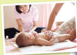
ベビーマッサージやベビードダンスなど親子でも楽しめるイベントを毎日のように開催中。