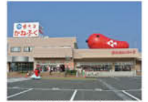
めんたいパーク(イメージ)