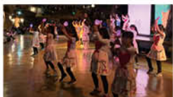
サンリオピューロランドでパレードスタッフにチャレンジ! 日時:12月14日(土) 元気いっぱいみんなと踊れてよかったです!