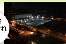
東扇島物流センター様