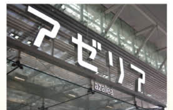
住 川崎市川崎区駅前本町26番地2 交 JR「川崎駅」東口を出てすぐ(京急川崎駅より直通)