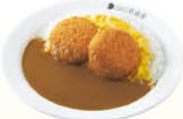
クリコスクランブルエッグ