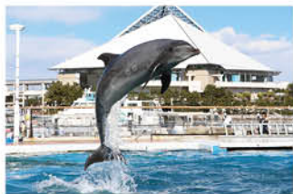
アクアリゾートパス

日本最大級的水族館と多彩なアトラクションで1日楽しめる！ 4つの水族館とアトラクション、そしてショッピングモールやレストランがそろった「海・島・生き物」のテーマパーク！