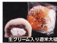
生クリーム入り遊米大福

多摩区堰 3-6-4 ☎044-811-2263 [営] 9:00～19:00 [休] 月曜日