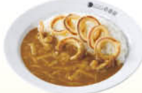
イカチーズカレー