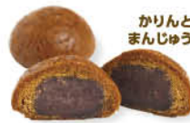
かりんとまんじゅう

高津区溝口 1-18-1 ☎044-833-3057 [営] 10:00～17:00 [休] 無休