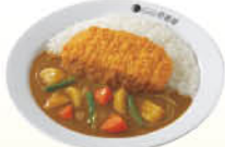
ロースカツやさい