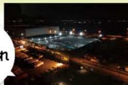
東扇島物流センター様