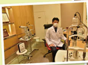
最新鋭の設備と知識のアップデートがあるからこそ、確かな診療につなげることができる。