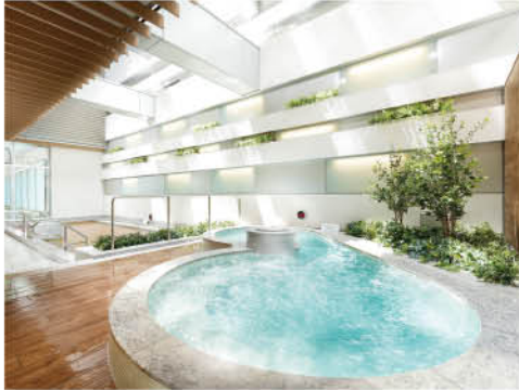
【泉天空の湯】 ヴィラフォンテーヌ 東京有明 スパ棟5階