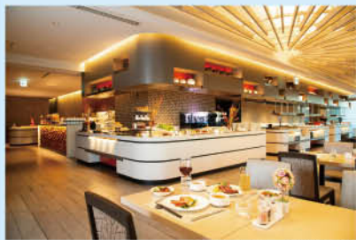
ブラスレリー「フローラ」