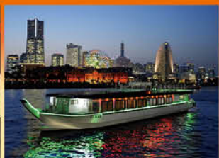
※画像はイメージです

大人気の濱進乗合コースでご利用いただける補助券をご用意しました。大人2名様からご利用できますので、ご家族や同僚とのリラクゼーションなど少人数で楽しむ屋形船は、いつもと違う雰囲気味わえます。お気軽にご乗船ください!