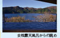
女性露天風呂からの眺め