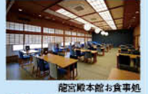
龍宮殿本館お食事処