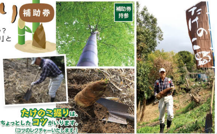
たけのこ掘りは、 ちよつとしたコツがいります。 (コツのレクチャーいたします)