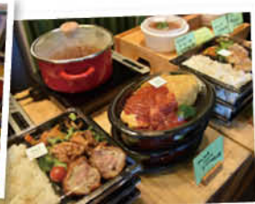
パッと食べられるお弁当メニューからメインディッシュとなるお惣菜まで、バラエティ豊かな家庭の味が並ぶ。

【利用方法アイコンについて】 本誌掲載メニューの利用方法については、下記のアイコンで表示しております。