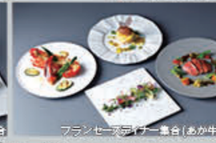
フレンチディナー集合(あか牛)