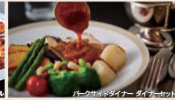
パークサイドダイナー ディナーセット