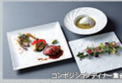
コンポジションディナー集合