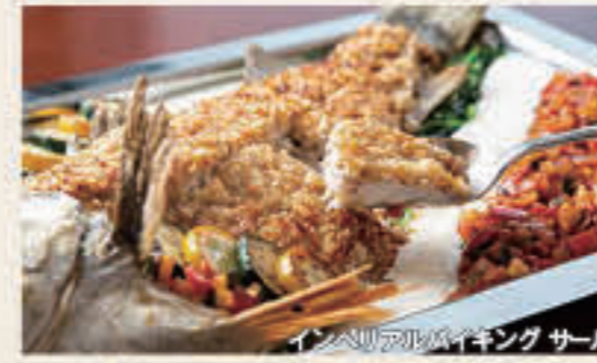
インペリアルバイキングサール