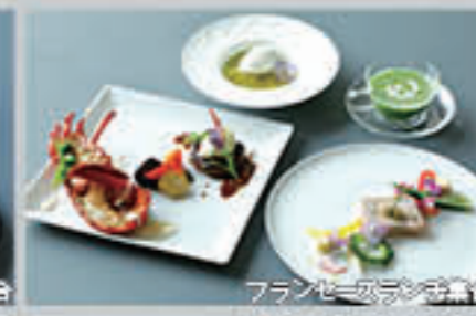
フレンチランチ集合