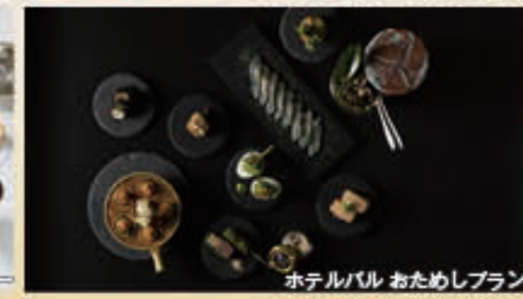
ホテルバル おためしプラン