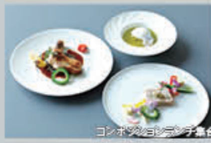
コンポジションランチ集合