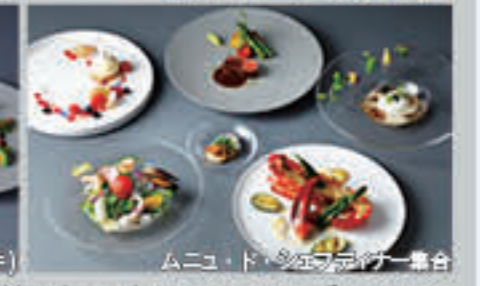
ムニョ・ド・シェフディナー集合

都心の眺望を楽しみながら、愉しく、おいしく、特別な時間をお過ごしいただける個性豊かなレストランがございます。