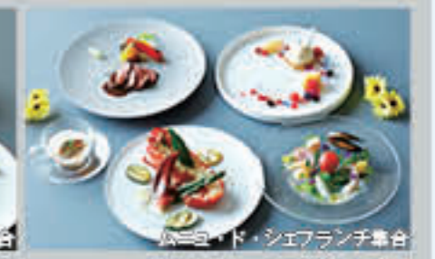
ムニョ・ド・シェフランチ集合