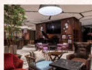
バー&ラウンジ「マグダレーナ」 (ホテル2F)