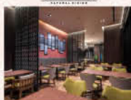
レストラン「ヴァルトハウス」 (ホテル1F)