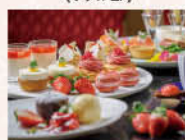
NEW アフタヌーンティーセット

《ウェルネスキューズ》をコンセプトに掲げるホテルグランバハ東京銀座では、美味しさと栄養バランスを大切にしています。 レストラン「ヴァルトハウス」が提供する季節毎の代表的なメニューの心と体に嬉しいランチコースを提供いたします。 料理長とウェルネスフード・コンシュルジュが奏でる季節の食材をふんだんに使用したスイーツやセイボリーをお届けします。