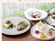
人気のウェルネスランチコース