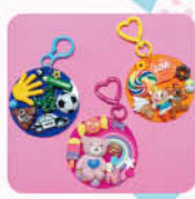
シャカシャカキーホルダー(1コース1つ作成)