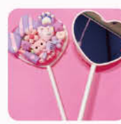
ハートスティックミラー

色とりどりのキラキラパーツを使って、世界にひとつの自分だけのオリジナルアイテムを作ろう！全部で3コースのキラキラアイテムをご用意しました！最大2コースまで選んで作成できます！