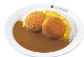
クリームコロケスクランブルエッグ