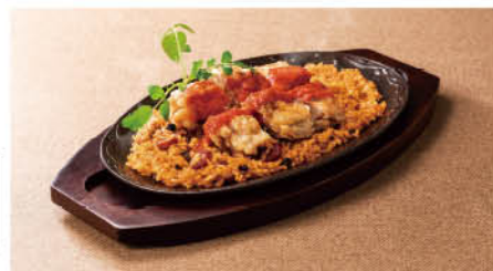
チキンジャンバラヤ