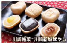
川崎銘菓 川崎新城ばやし