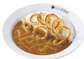
イカチーズカレー