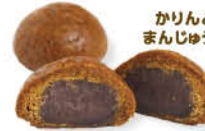
かりんとまんじゅう

高津区溝口1-18-1 ☎044-833-3057 [営] 10:00～17:30 [休] 不定休