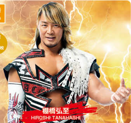
棚橋弘至 HIROSHI TANAHASHI