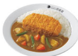
ロースカツやさい