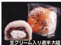
生クリーム入り遊米大福