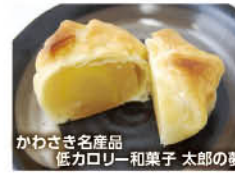
かわさき名産品 低カロリー和菓子 太郎の夢