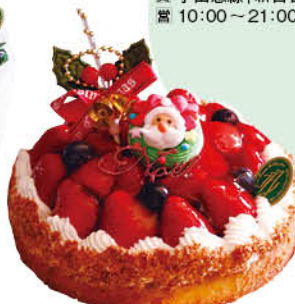
タルトフリーズノエル