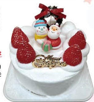
X'mas生クリーム苺サンドデコレーションケーキ