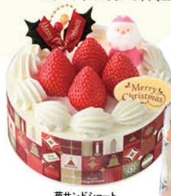
莓サンドショート