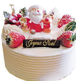
生クリームデコレーション

住 川崎市麻生区上麻生 1-4-1 B1F 交 小田急線「新百合ヶ丘駅」より徒歩約1分 営 10:00～21:00 ☎ 044-965-3036