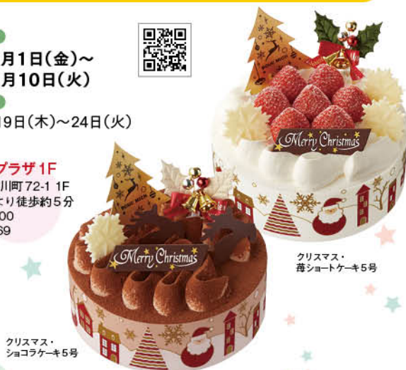
クリスマス・ 苺ショートケーキ 5号