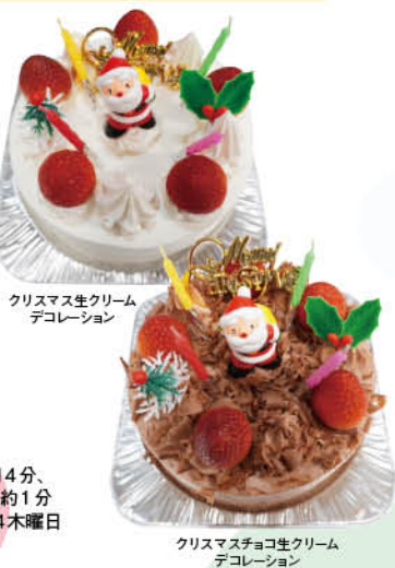
クリスマス生クリーム デコレーション