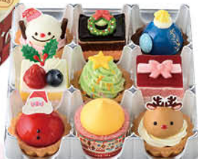
サンタさんのクリスマスマーケット(9個入)