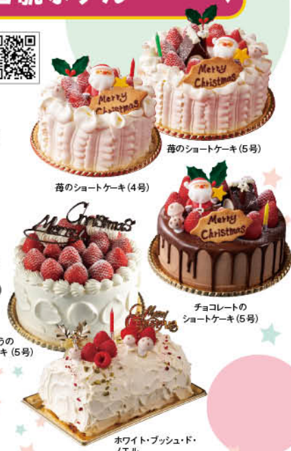
苺のショートケーキ(5号)