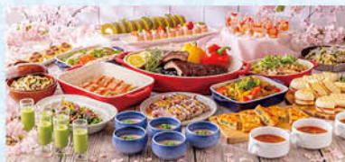
ブラスセラー フローラ「ランチビュッフェ」(イメージ)

「ランチビュッフェプラン」と「ランチ&リフレッシュプラン」の2プランが選べます!