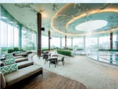
バーデゾーン(10種類のプール)