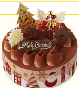
クリスマス・ショコラケーキ5号