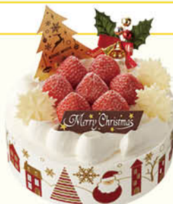
クリスマス・苺ショートケーキ5号