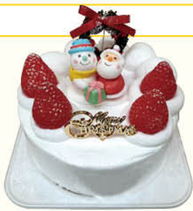
X'mas生クリーム苺サンドデコレーションケーキ