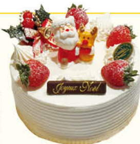
生クリームデコレーション

※オーナメントの在庫状況により飾りやデザインが多少変更になる場合がございます。ご了承ください。