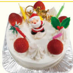
クリスマス生クリームデコレーション

住 川崎市川崎区台町7-8 交 京浜急行大師線「川崎大師駅」より徒歩約14分、川崎市営バス、臨港バス「台町」下車 徒歩約1分 営 9:30～20:00 定休日：火曜日、第2・4木曜日 ☎ 044-299-0220