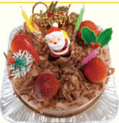
クリスマスチョコ生クリームデコレーション