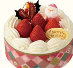
苺サンドショート (4.5号)