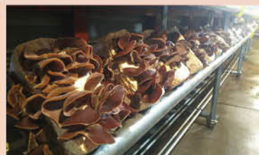
栽培中のきくらげ