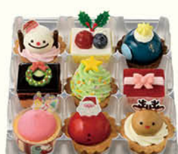
サンタ村のクリスマス (9個入)