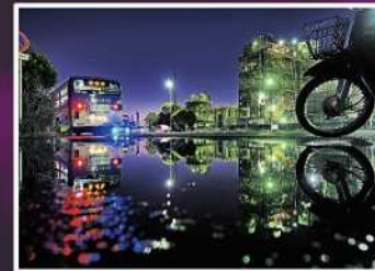
入賞【工場街のイルミネーション】 撮影場所：千鳥町（川崎区）