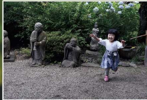
優秀賞【石像に見守られて】 撮影場所：浄慶寺（麻生区）