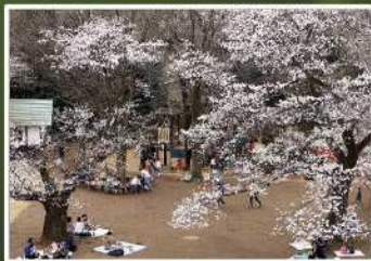
入賞【花見日和】 撮影場所：枳形山（多摩区）