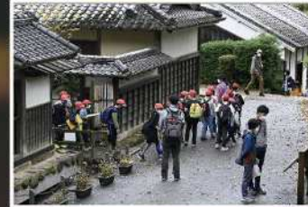
入賞【修学旅行】 撮影場所：生田緑地（多摩区）