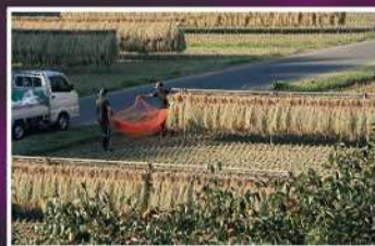
入賞【収穫の季節】 撮影場所：岡上市民防災農園