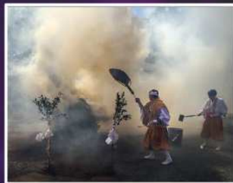
入賞【天界に届け】 撮影場所：川崎大師（川崎区）