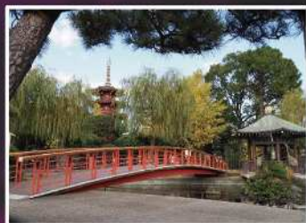
入賞【川崎大師平間寺つるの池】 撮影場所：大師平間寺（川崎市）

味の素株式会社川崎事業所 川崎市遊技場組合 葵薬品産業株式会社 井筒まい泉株式会社 川崎浴場組合連合会 株式会社丸井 マルイファミリー溝口 株式会社アトレ 川崎店 株式会社 総商 三田港運株式会社 (株)川崎フロンターレ 興和油化工業株式会社 株式会社泉屋東京店 日本鑄造株式会社 株式会社一条機械製作所 株式会社 ソフテム 宗教法人稲毛神社 日本ホテル株式会社 ホテルメトロポリタン 川崎 沼田工業株式会社 第一生命保険株式会社川崎支社