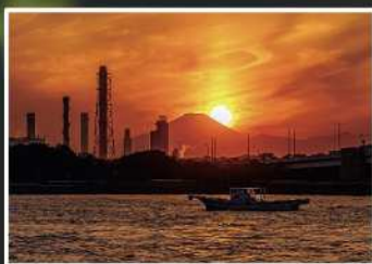
入賞【ダイヤモンド富士】 撮影場所：東扇島西公園（川崎市）