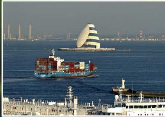
優秀賞【今日もご安全に】 撮影場所：東扇島（川崎区）