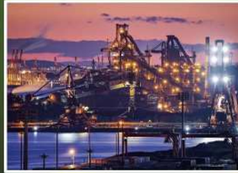
入賞【京浜の巨頭、最後の輝き】 撮影場所：東扇島（川崎区）