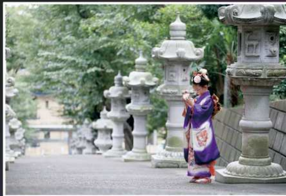
優秀賞【氏神様へのお参りの前に】 撮影場所：馬絹神社（宮前区）