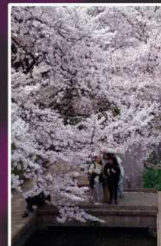
入賞【桜満開笑顔も満開】 撮影場所：宿河原（宮前区）