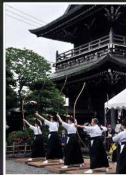
入賞【集中して!】 撮影場所：川崎大師（川崎区）