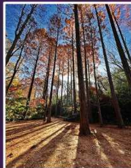
入賞【神聖な森】 撮影場所：生田緑地（多摩区）