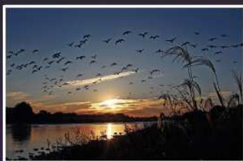
入賞【群れが来る朝】 撮影場所：中野島の多摩川岸（多摩区）