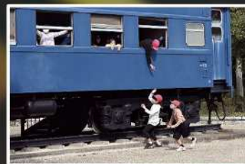
入賞【客車と遊ぶ】 撮影場所：生田緑地（多摩区）