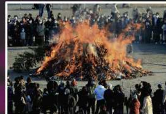
入賞【願いを込めて】 撮影場所：丸子橋（中原区）