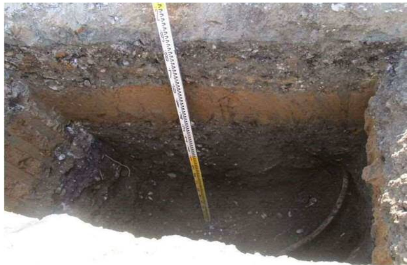
南面 GL-1.4m付近 \phi 30mmの丸鉄筋あり