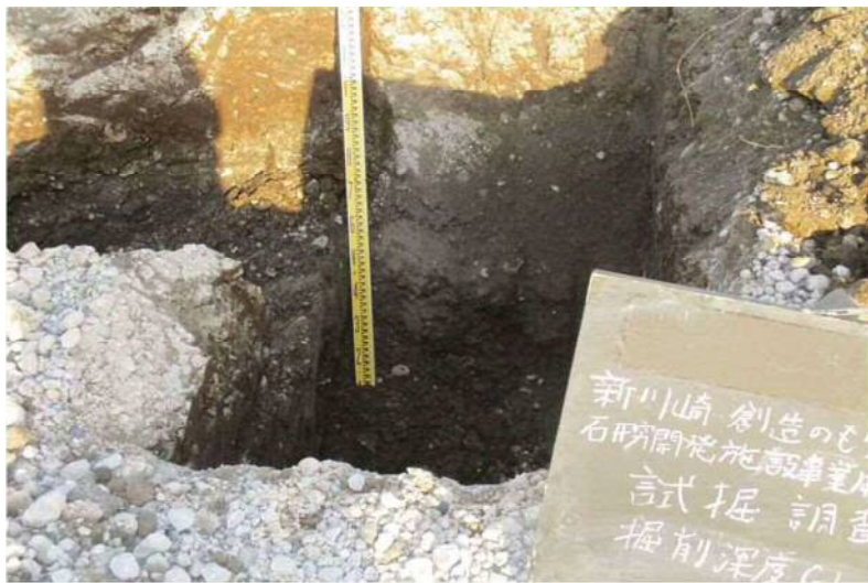
き-4地点 地盤改良盤の南側端部 改良地盤の上端は、T.P+5.8m付近