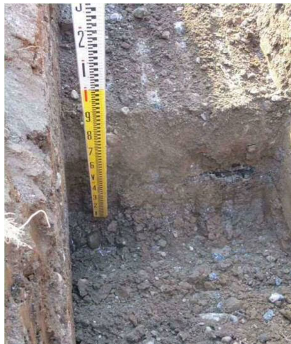
改良地盤東側端面 改良地盤の上端は、T.P+5.8m付近