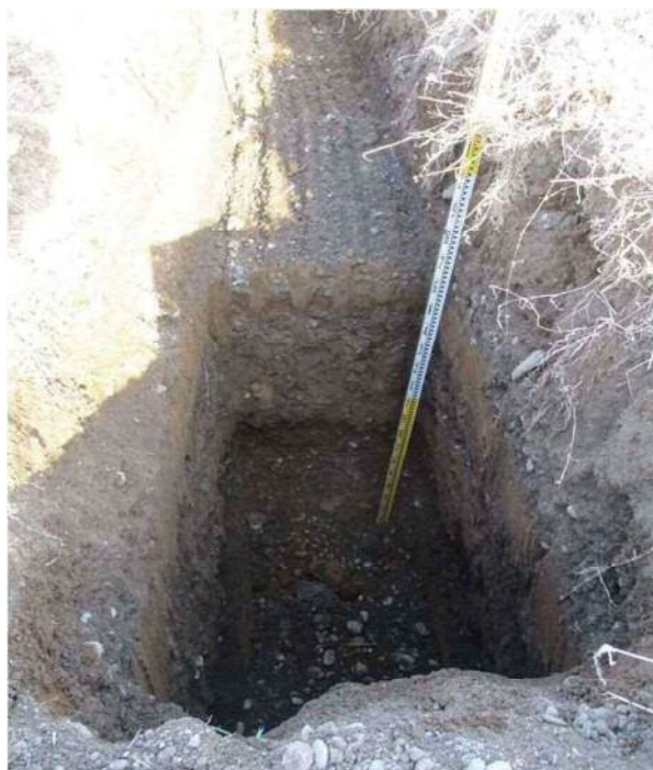
改良地盤西側端面