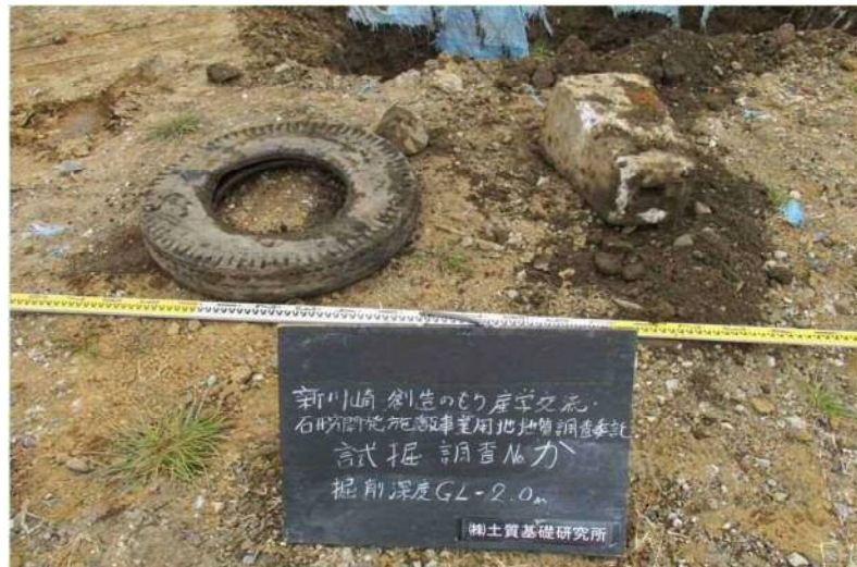
タイヤ・電力線基礎:GL-1.5m付近に存在