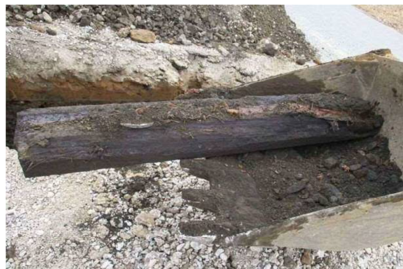
埋没した枕木 GL-1.4m付近、25cm角、防腐剤(コールドール?)臭あり。