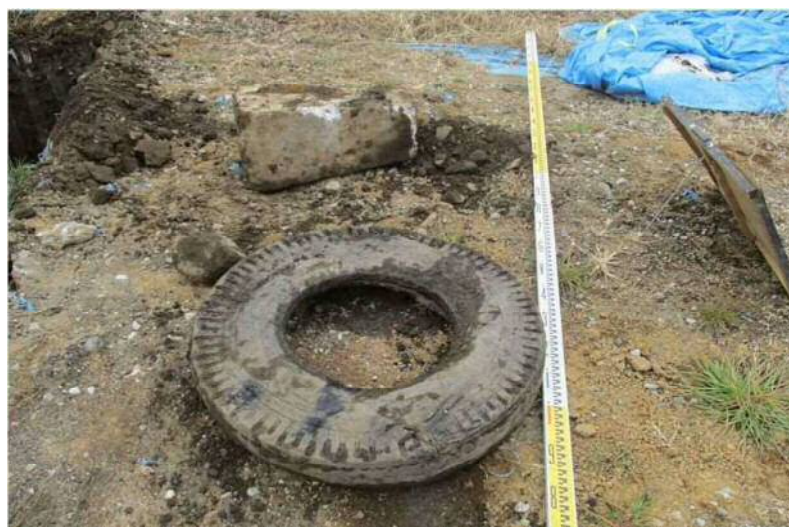
タイヤ・電力線基礎