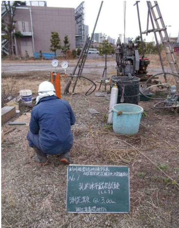
孔内水平載荷試験