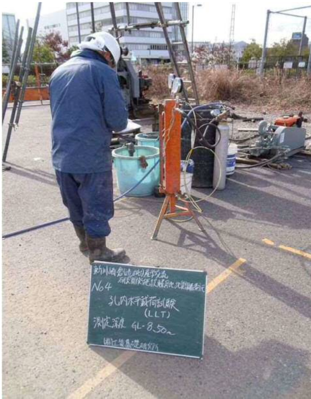
孔内水平載荷試験