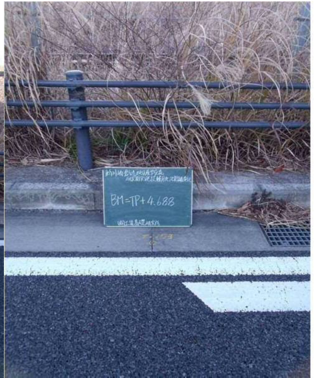
近 景 BM=T.P+4.688m