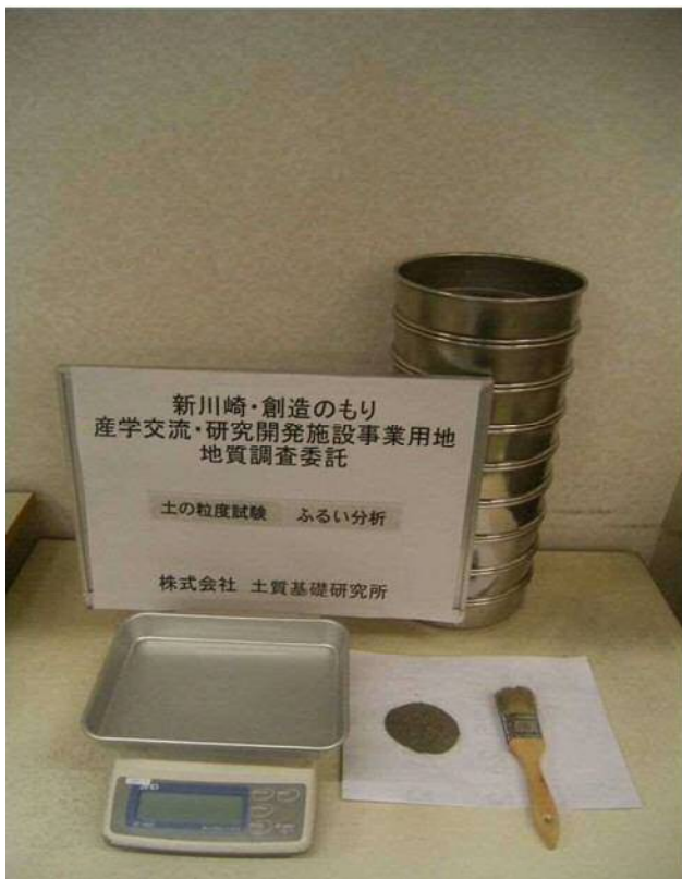
土の粒度試験(ふるい分析)