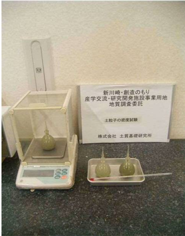
土粒子の密度試験