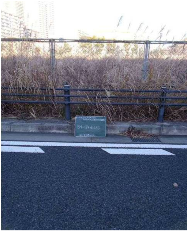
遠 景 敷地北側 道路JR側