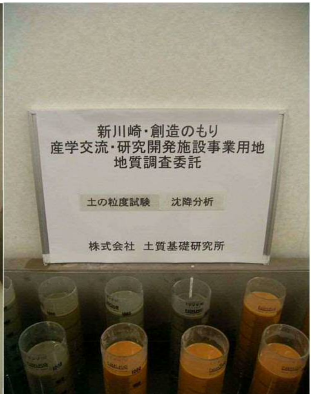
土の粒度試験(沈降分析)