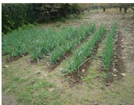
ネギ 収穫祭で戴きました