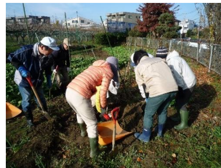
手芋の収穫してま〜す! スコープの位置 難しい〜ぞ