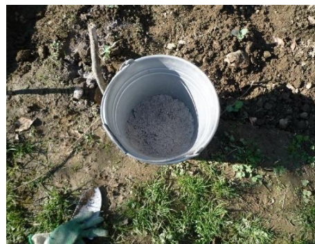
収穫祭ででた草木灰です。 苦土石灰よりも酸度調整能力が あるそうです