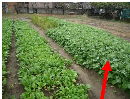
育苗中のノラボウ菜(多摩名産) おひたしは最高の絶品!!