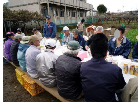
こんな感じでテーブル囲んです