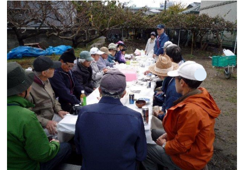
総勢20数名 圧巻です