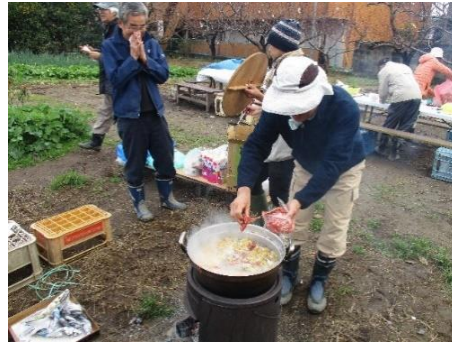
恒例の芋煮。うまくいきます様に！（先輩料理）