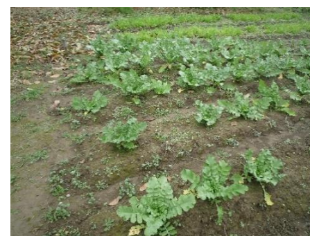
大根 収穫祭で戴きました