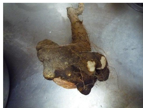
手芋 綺麗に洗った写真