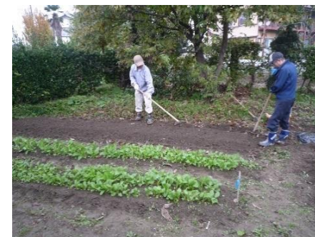
丁寧な作業が収量を増やします