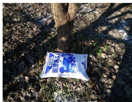
梨のお礼肥をこれから行います 全部で350袋と物凄い量です