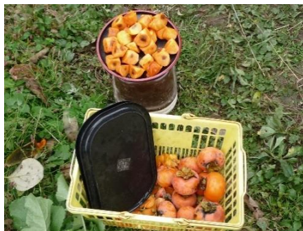
休憩時の果物おやつ いつも美味しいです！ 園主さん 感謝です