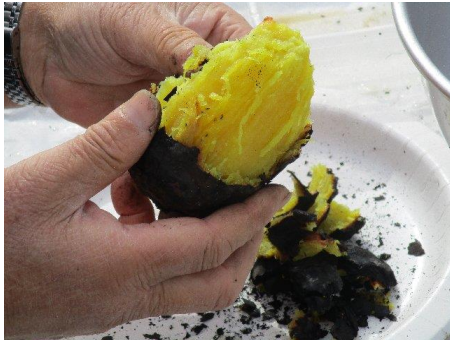
採れたての芋で～す