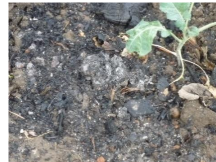
酸度土壌調整。苦土より効果の 高い”草木灰”を利用してます