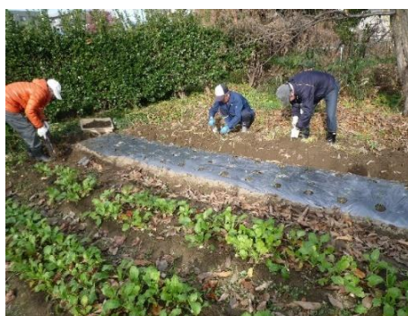
整地作業をしています