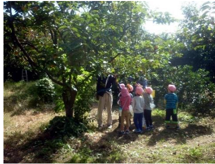
近所の子供達来園 収穫体験ワイワイ ガヤガヤ