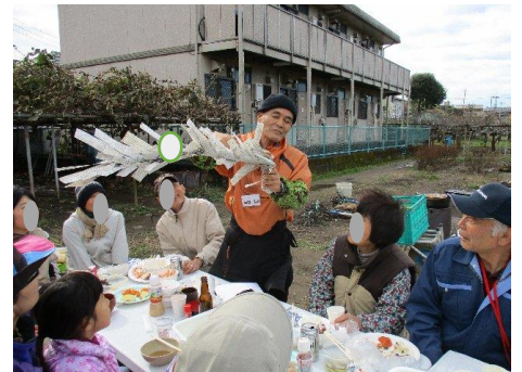
一夜漬けの手品、如何だったでしょう？