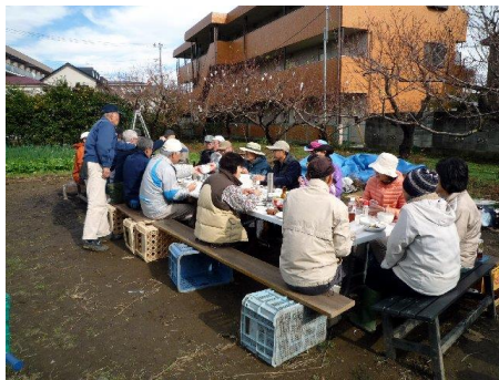
田園での収穫祭 必然的に盛り上がってしまいます