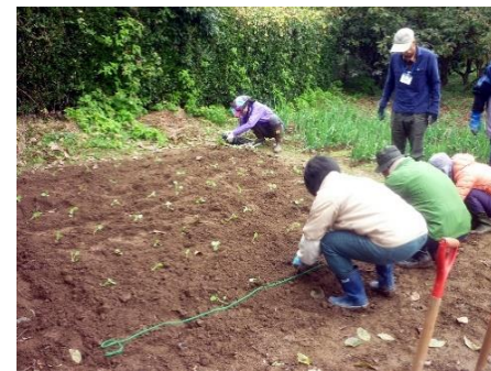
ブロッコリー 定植中