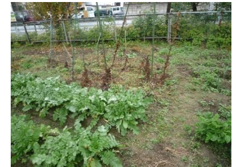
大根と手芋 そろそろ収穫か？