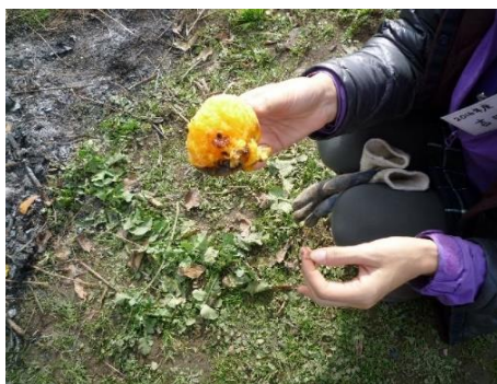
焼きみかん 風邪引かないとか?!