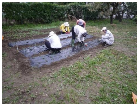
玉葱の植付け風景