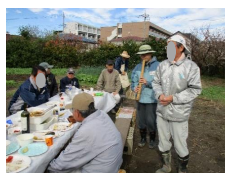
三味線と鍛えた喉のコーボ 益々の盛り上がり