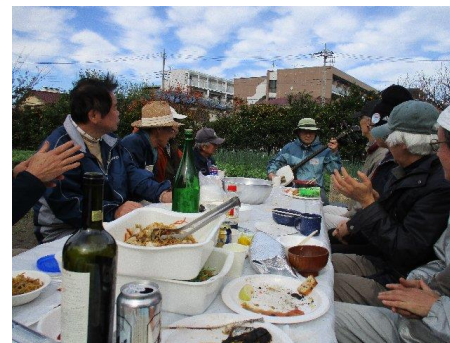
キャリア40年の三味線技に感動！ 心踊ります