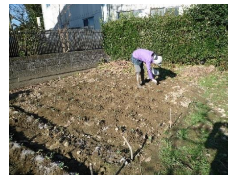
梨畑のブロッコリーに草木灰を 施肥しています