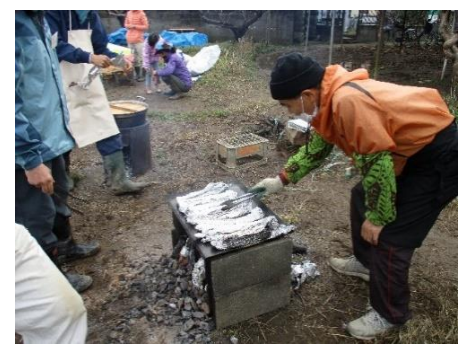
初トライの秋刀魚を焼いています。味はどうか？