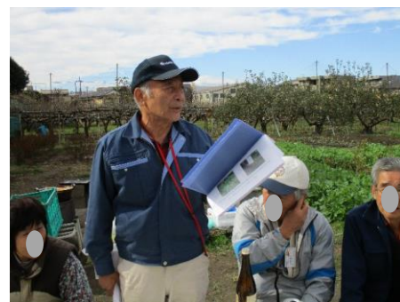
園主の開会 ご挨拶