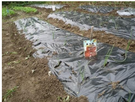
マルチングで大きく育てよ！