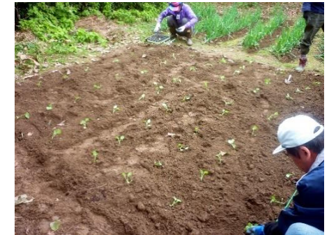
場所は梨畑“奥の院”