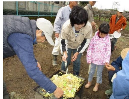
園主伝授の焼きそば。1年生が料理中（子供不安そう？）