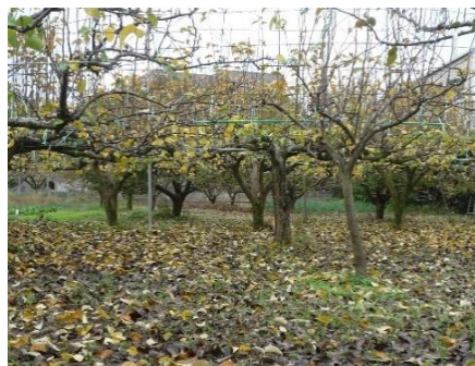
多くの恵みをもたらして、来年に 備えます（梨の木）