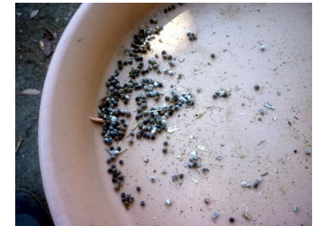
オクラの種 拡大図 ◇春に蒔きましょう