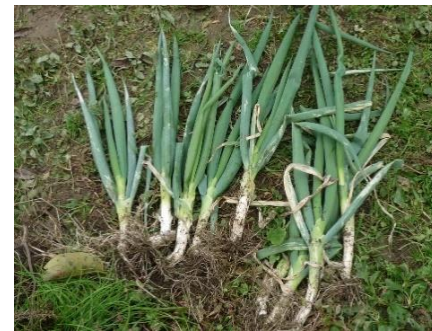
一本ネギも立派でした