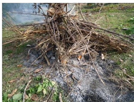
みかんを焼いています