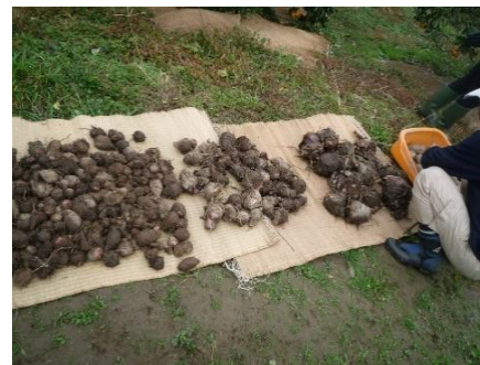
立派な里芋 ハツ頭？