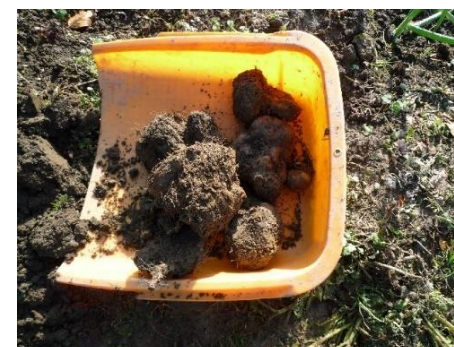
こんなに立派な芋ができました