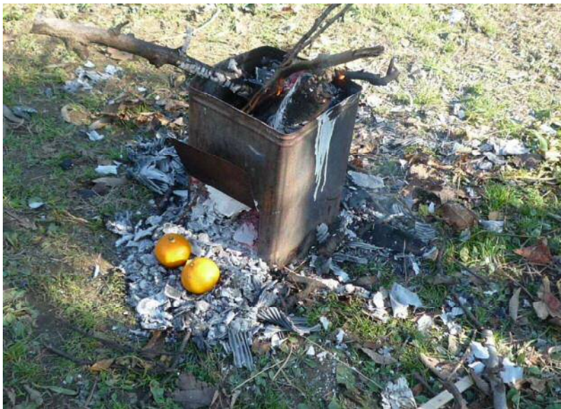
12/11 園主お勧めの焼きミカン（風邪を引かないそうです）