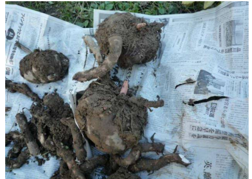
10/30 コンニャク沢山収穫できました