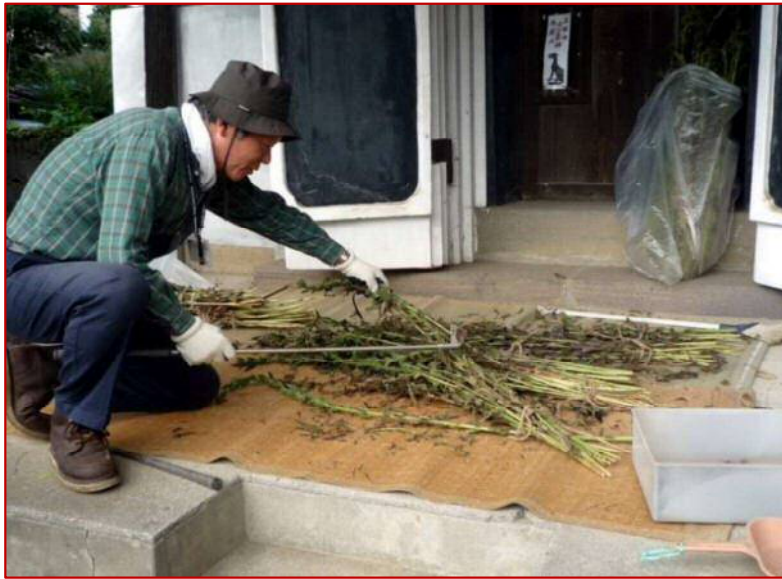
9 / 11 金ゴマの収穫風景 (倉庫前)