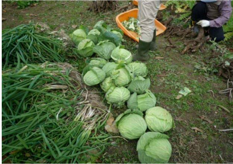
11/20 キャベツ害虫負けずに 大収穫でした