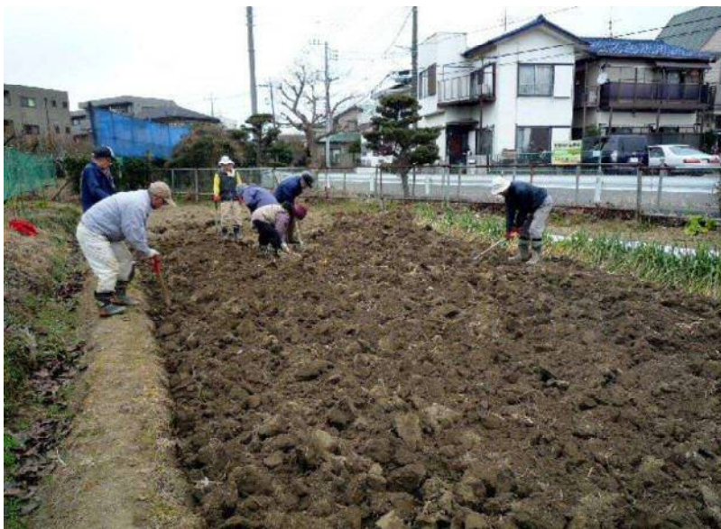
1 / 14 寒起こし作業