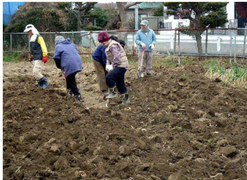
1 / 14 寒起こし作業