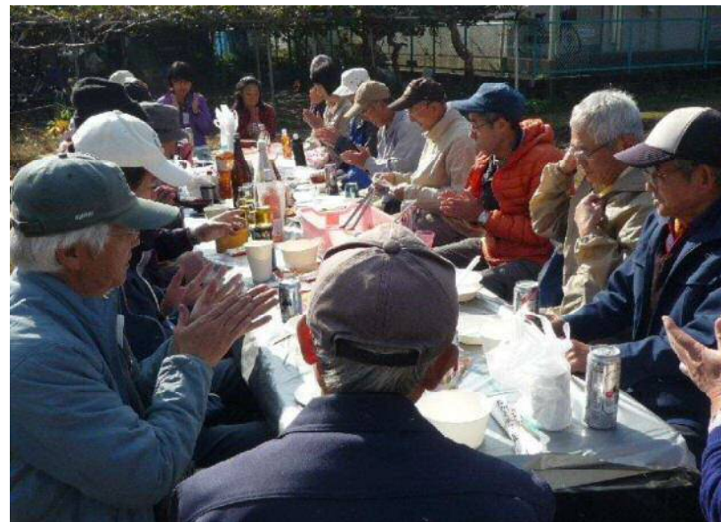
11/27 体験農園で収穫した野菜の料理満載