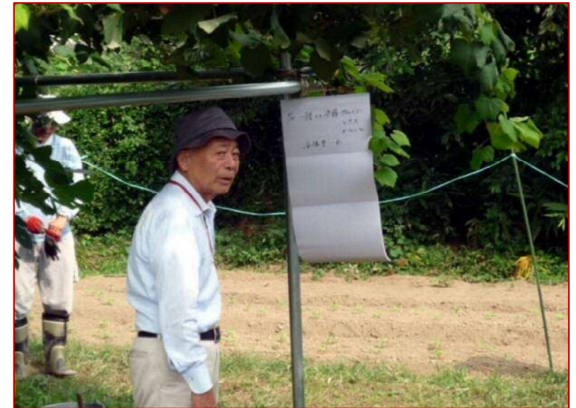
9 / 11 園主からの説明