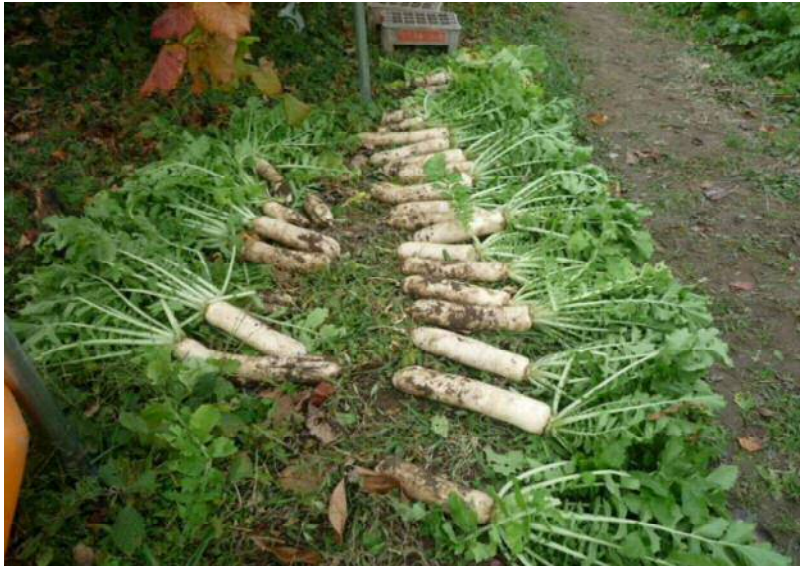
11/20 青首と総太り大根 凄いです