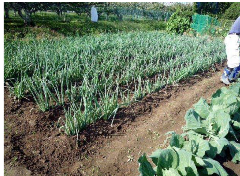
10/9 ネギが立派に成長してます