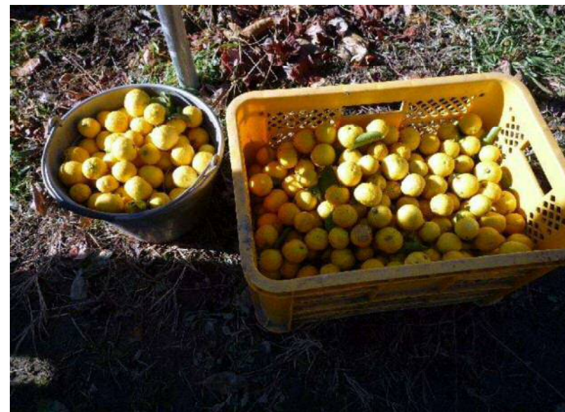
12/25 本日の収穫結果の一部です