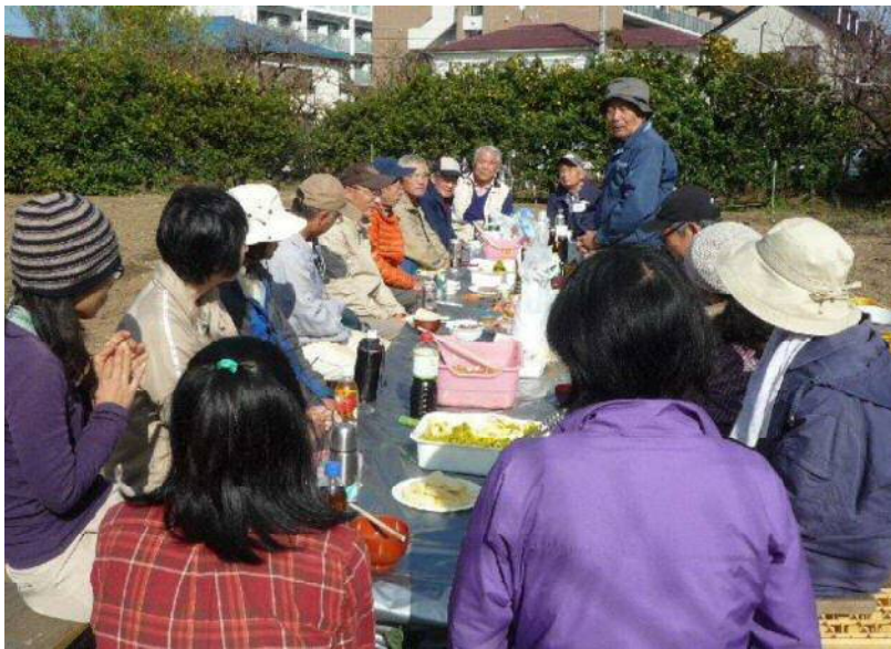
11/27 秋の収穫祭 (9月に続き2回目)