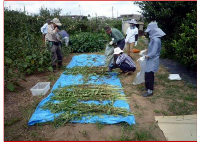
9 / 11 金ゴマの収穫風景 (圃場にて)