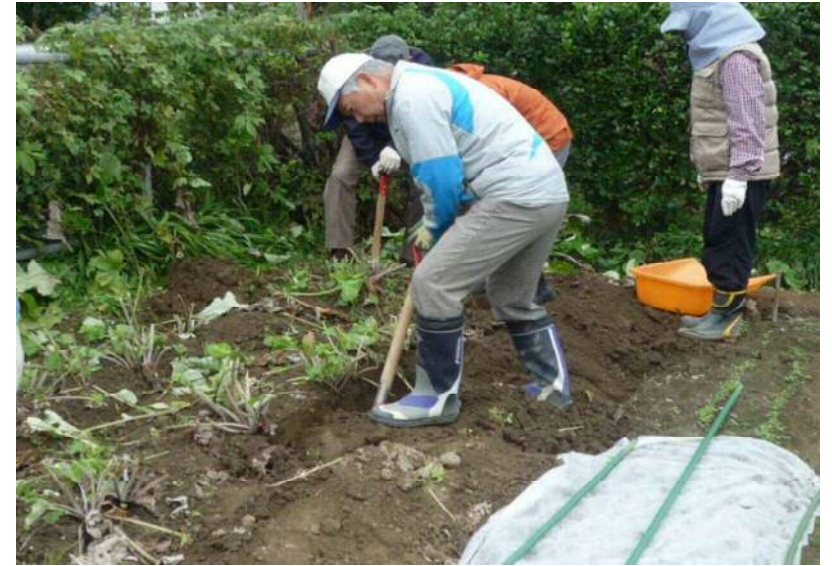
11/20 さらだゴボウの掘り出し中 (折らずに収穫するのは中々難しいのです)