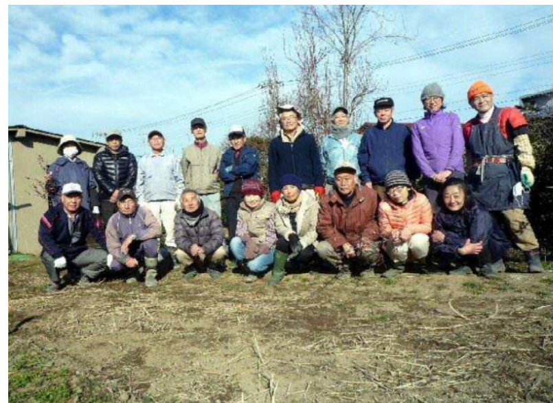
1 / 14 全員集合 ”お疲れ様でした”