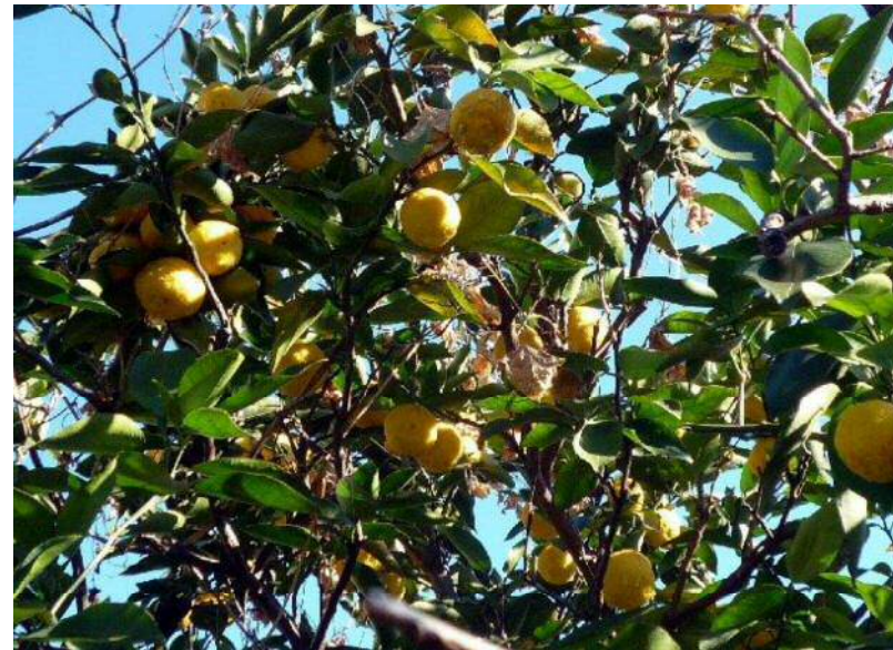
12/25 今日は柚子の収穫体験です