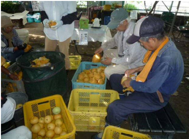
9 / 25 落下梨の仕分け作業中__1