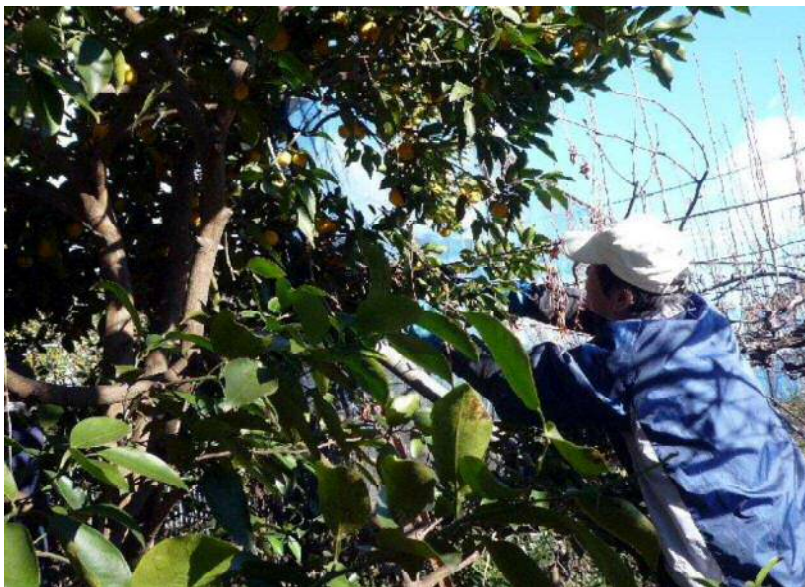
12/25 柚子の収穫風景（トゲが痛い!）