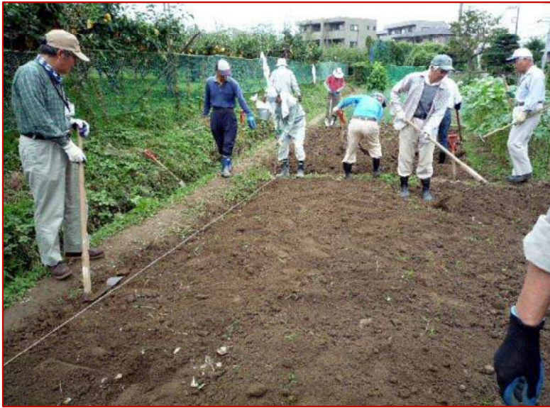
9 / 4 秋大根の畝作り_1