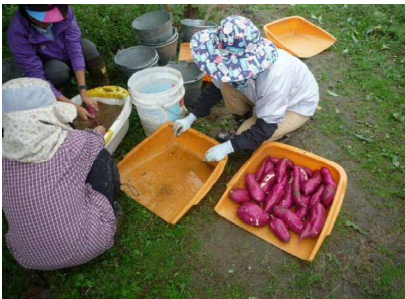
10/23 さつま芋 今年は収量多し