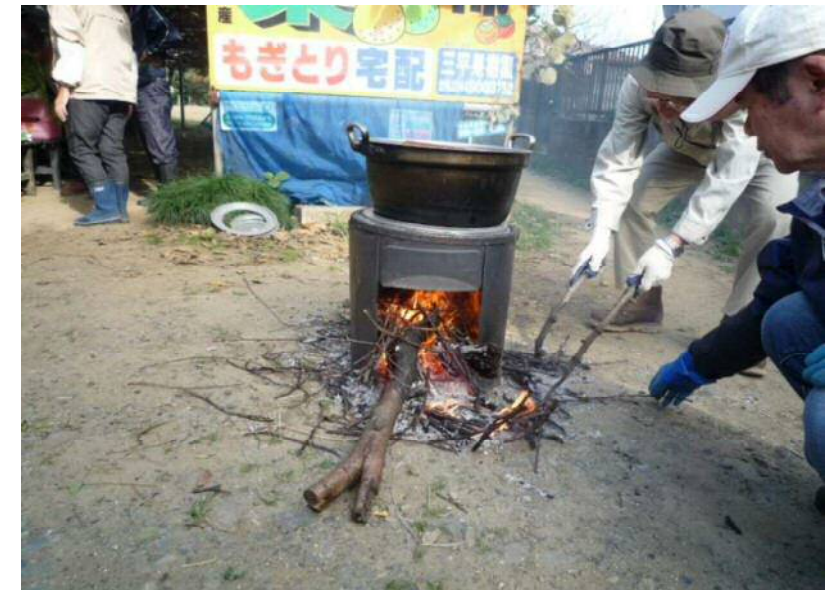
11/13 落花生を茹でています