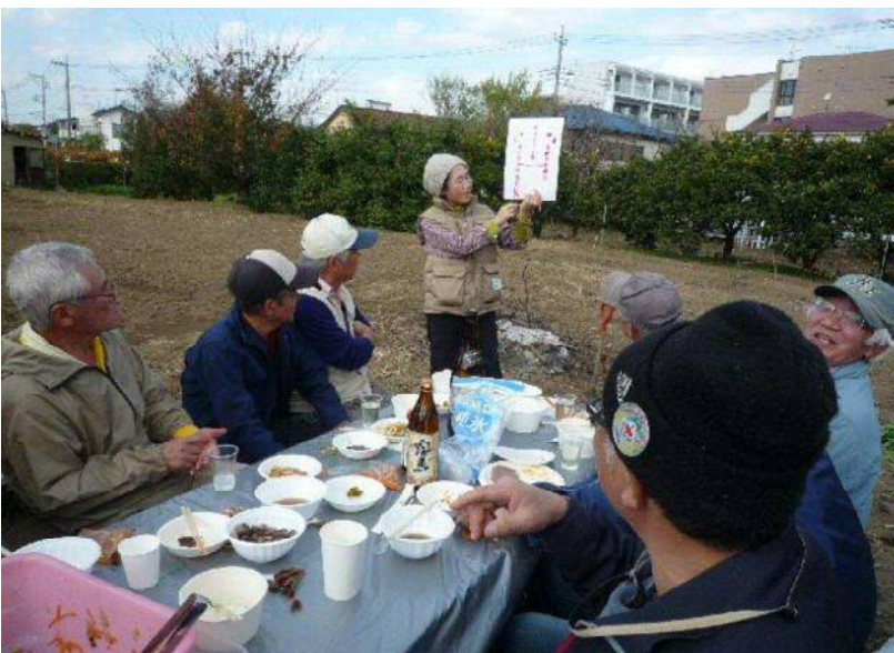
11/27 秋の収穫祭 (ゲーム中です)