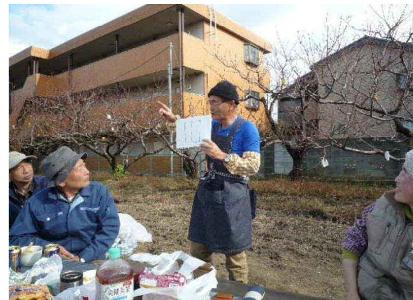
11/27 秋の収穫祭 (ゲーム中です)