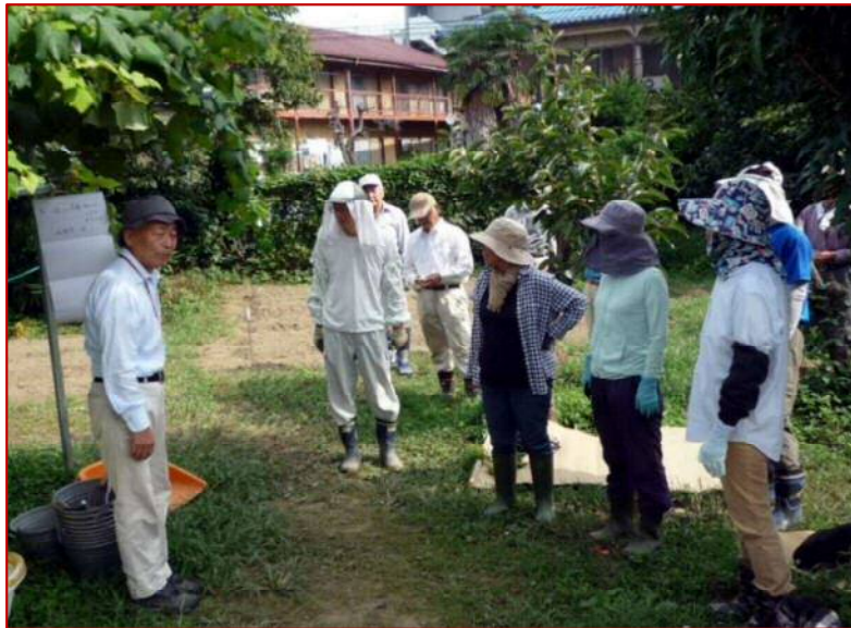
9 / 11 ブロッコリの土作り