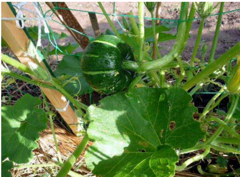
10/9 カボチャ実が大きくなる