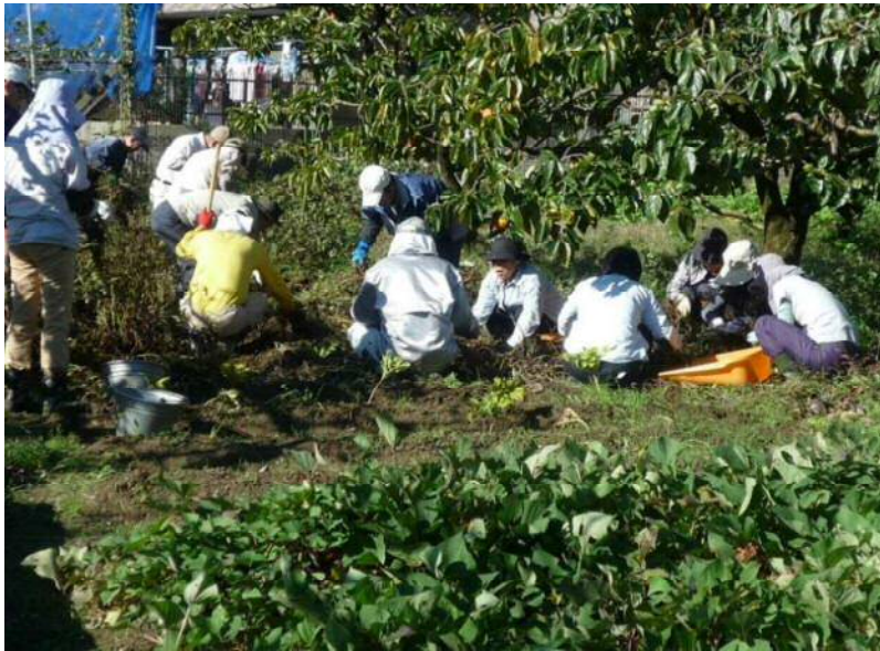
10/30 落花生の収量、今年は残念！