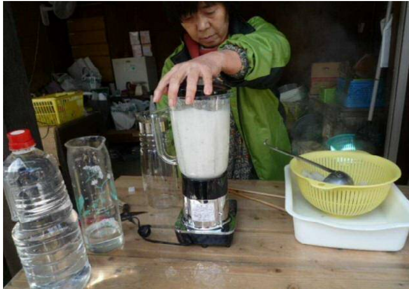
11/13 園主奥様直伝のコンニャク作り