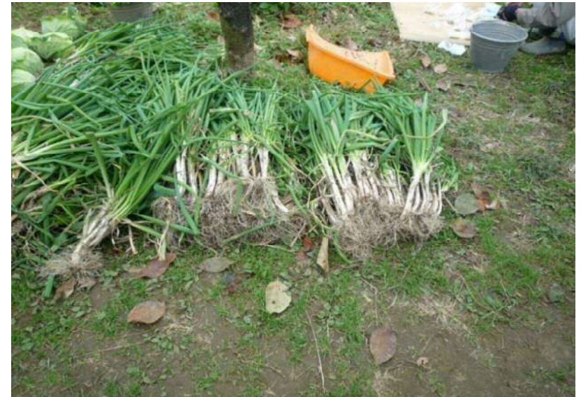
11/20 分けつネギも大量収穫でした