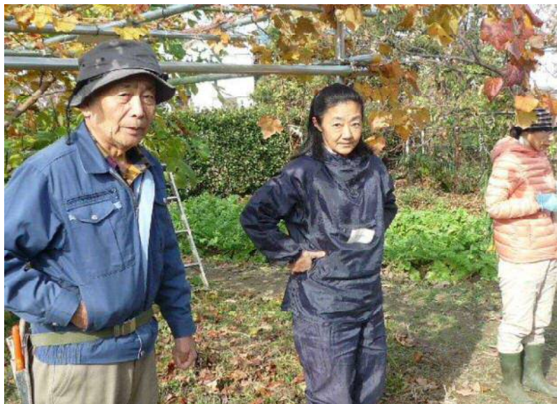
1 / 14 体験農園 最後の日