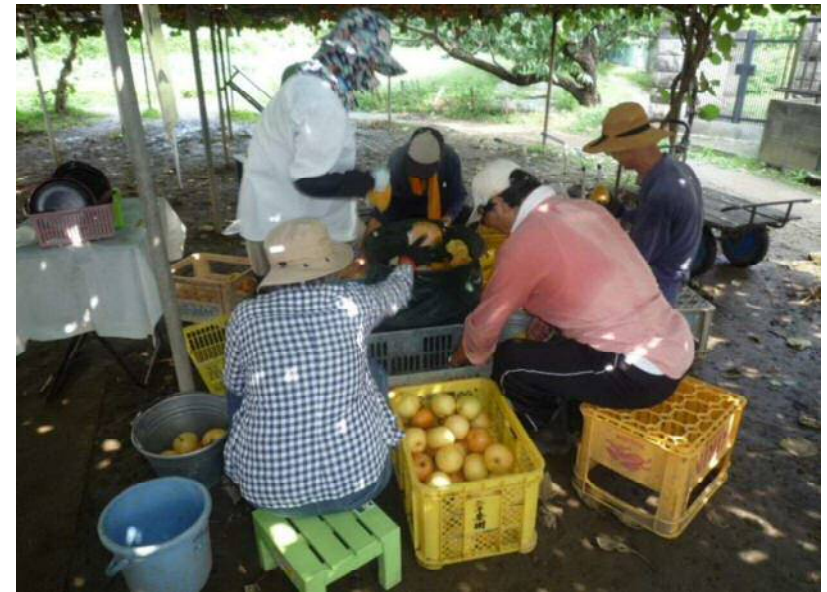
9 / 25 落下梨の仕分け作業中__2