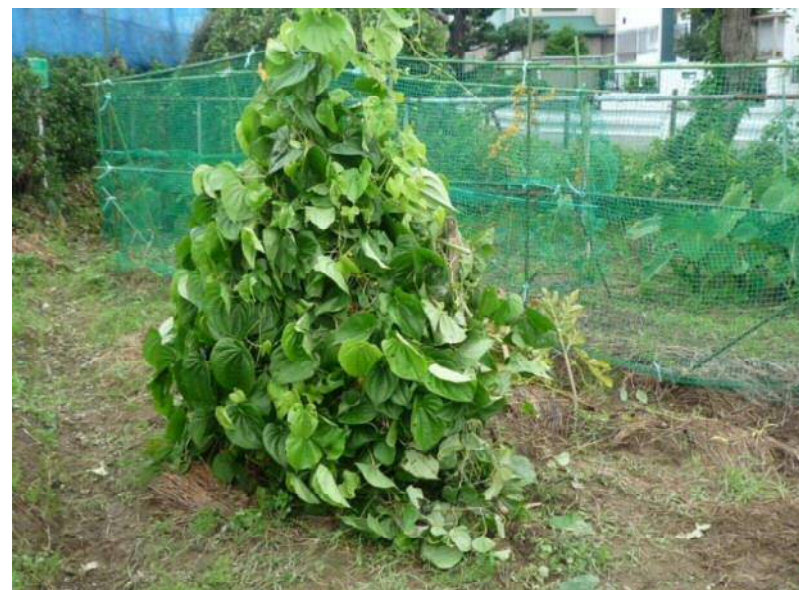
10/23 そら芋こんなに大きくなりました