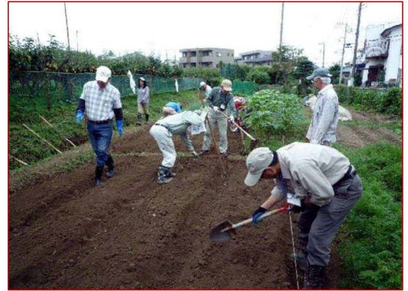
9 / 4 秋大根の畝作り_2