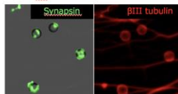
ヒトiPS細胞由来運動神経細胞（未梢）