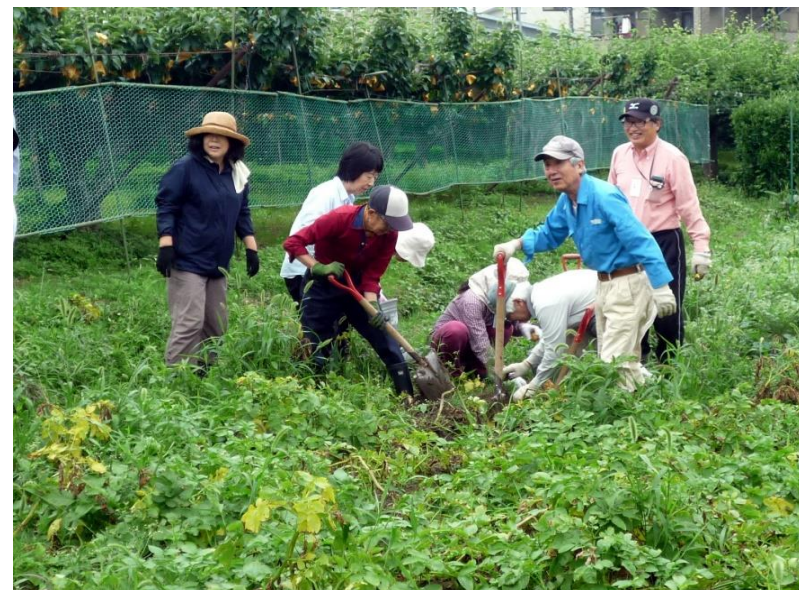
じゃが芋の収穫中 2