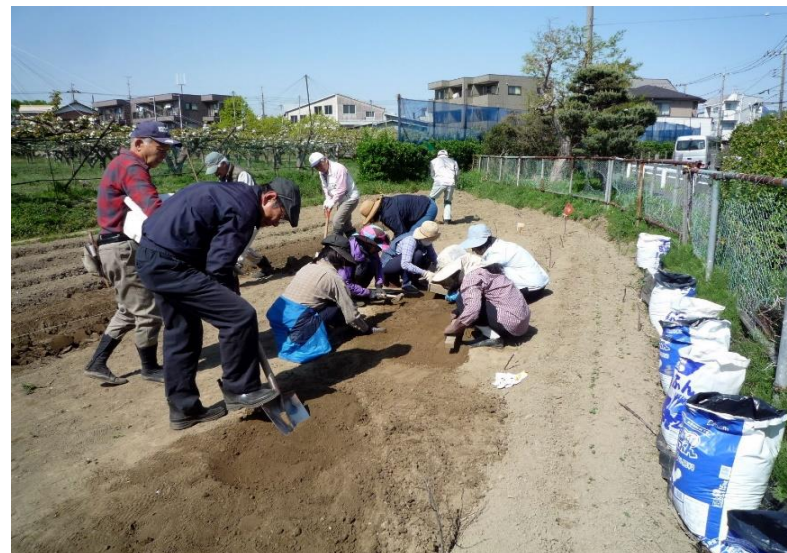
皆で色々な種まきをしています