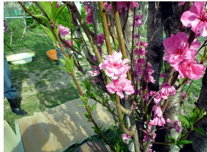
桃の花 綺麗なピンク色です