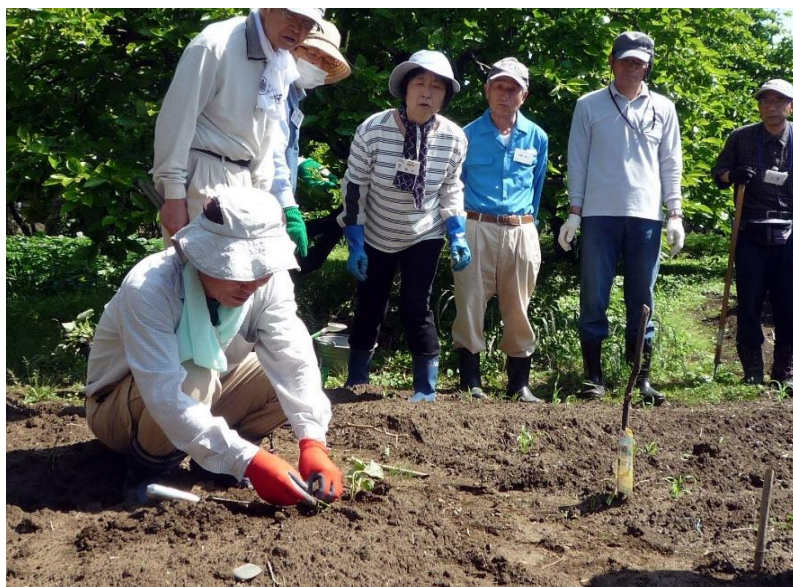
さつま芋 苗の植え方指導中