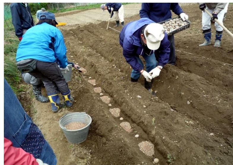
種芋を畝に置いていきます