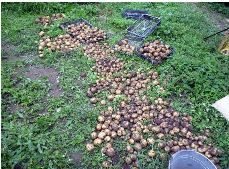
今年も多くの収量です