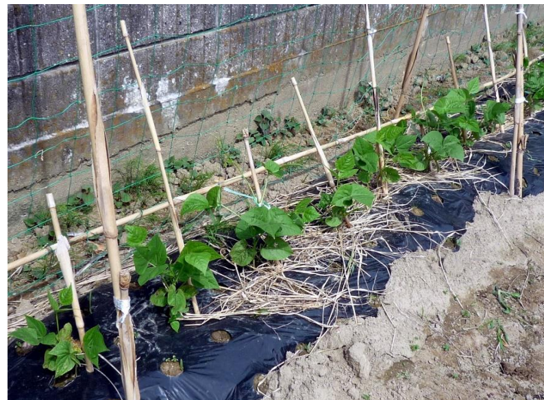
つる有リスナップエンドウが発芽