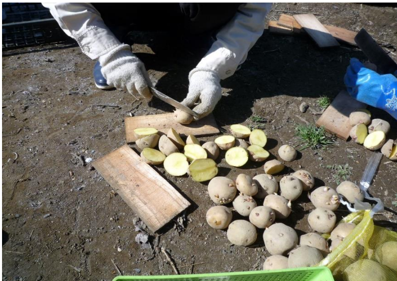
じゃが芋の種芋を半分にカット中