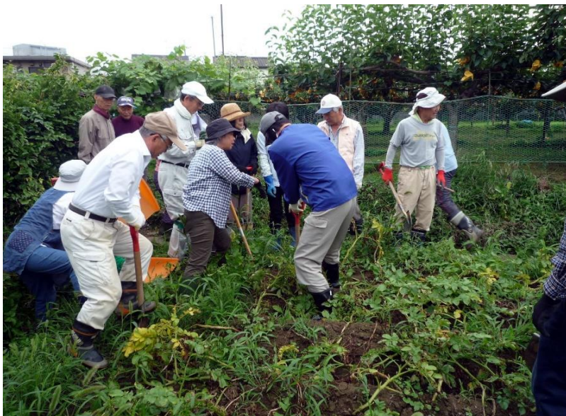
じゃが芋の収穫中 1