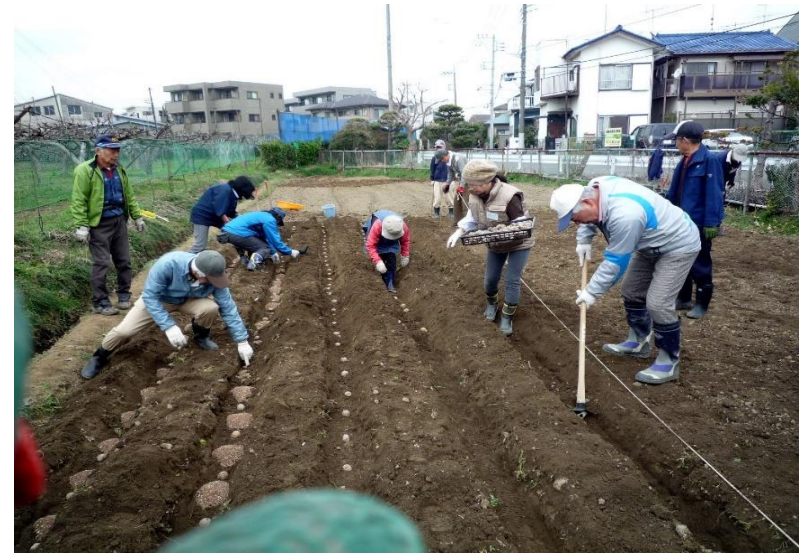
沢山の畝作りと定植を分担して作業