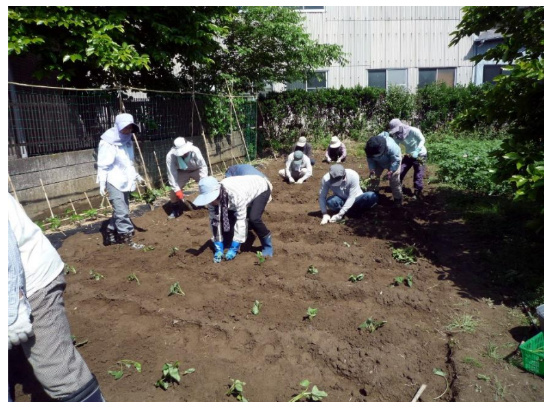
さつま芋 皆で定植中