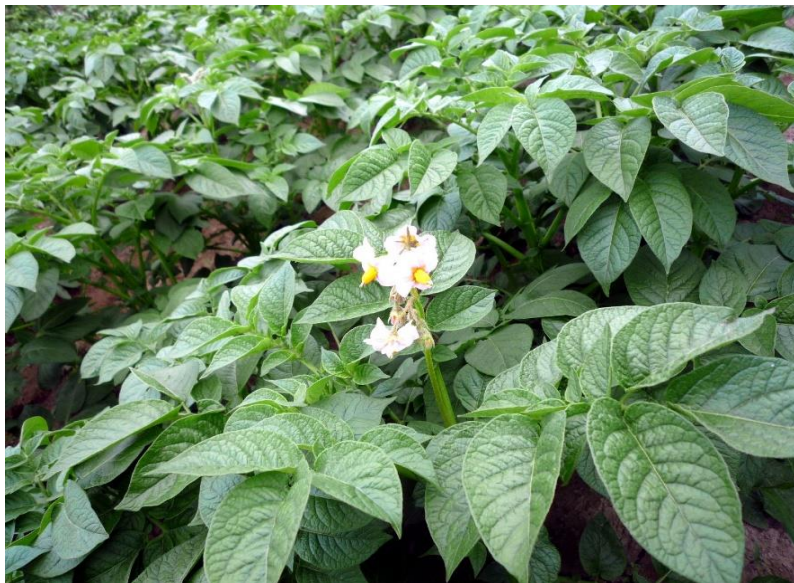
じゃが芋 開花しました