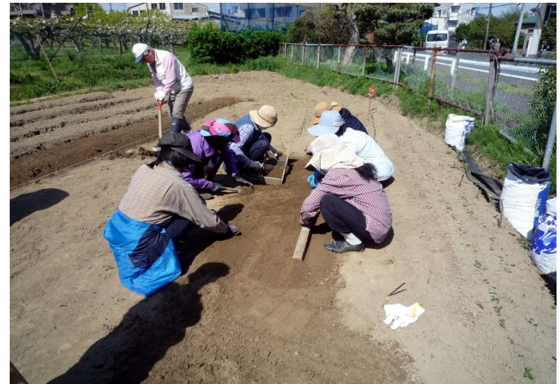
種蒔き前の土作り