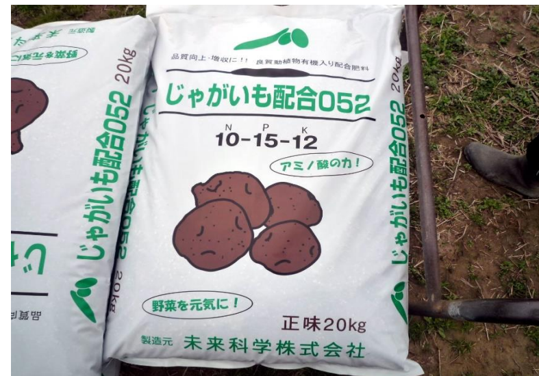
じゃが芋定植時に施肥する肥料