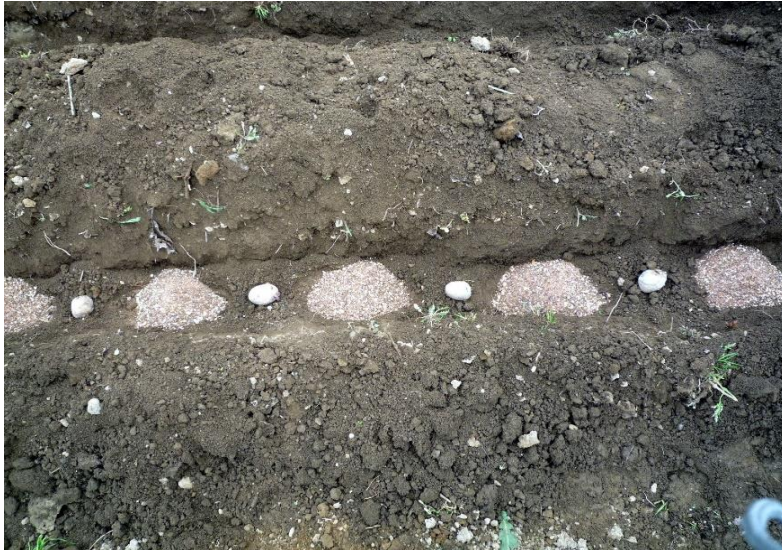
種芋の間に施肥（接触しない様！）