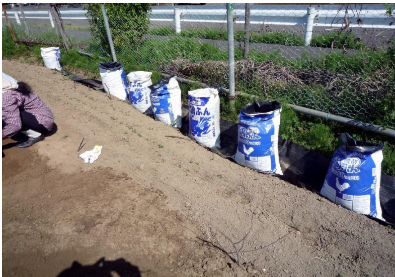
サラダごぼうを肥料袋に種まき (収穫の際 袋方式が大変楽です)