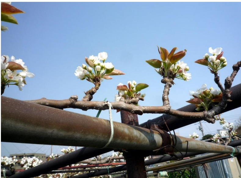
梨の花 ぐんぐん伸びています