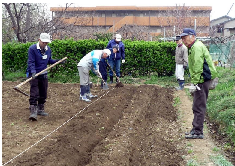
園主指導でじゃが芋の畝作り中