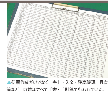
▲伝票作成だけでなく、売上・入金・残高管理、月次計算など、以前はすべて手書・手計算で行われていた。