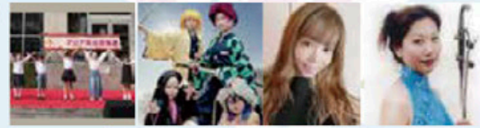
▼かわさきインドフェスティバル▼