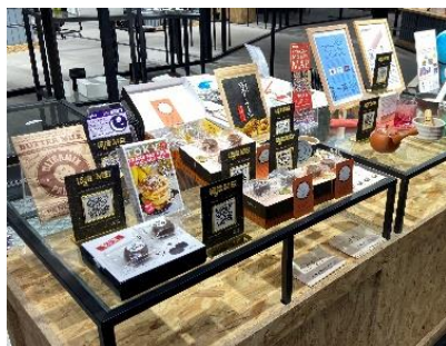
イオン・モールカンボジア出展の様子

新型コロナウイルス感染症の影響の長期化や、原材料費・物流費の高騰等に直面する市内中小企業の海外販路開拓を支援するため、越境EC（国際的な電子商取引）を活用したテスト販売に参加する企業を募集いたします。