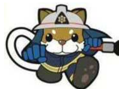
川崎市消防局 イメージキャラクター 太助