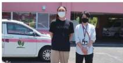
▲特別養護老人ホーム 金井原苑 職員の皆様