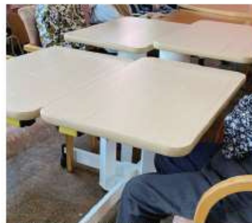
▲「ここあ」ご利用の様子