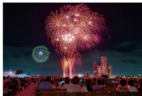
第63回川崎市観光写真コンクール優秀賞 「仲秋、桃色に染まる」内田景梧

購入方法 チケットぴあにて販売 川崎会場：7月30日（日）正午～ 上野毛会場 Aエリア：8月13日（日）午前10時～ Bエリア：7月30日（日）正午～