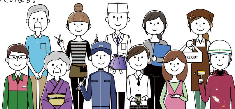
川崎市内の労働災害発生状況（新型コロナウイルス感染症によるものを除く）