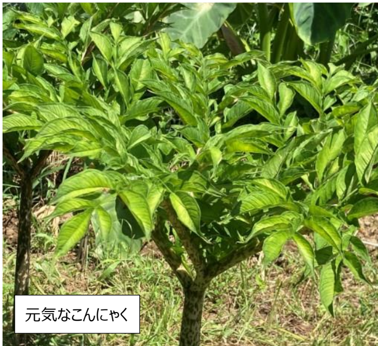
元気なこんにゃく

8月は本当に暑い。今月は新たに枝豆の種蒔きをした。6月に植え付けたこんにゃくも元気に育っている。ここ登戸の三平果樹園では梨が実り、8月の最終週に園主が梨をメンバーに振舞って下さった。今月の主な収穫物は、なす・かぼちゃ・オクラ・小松菜。