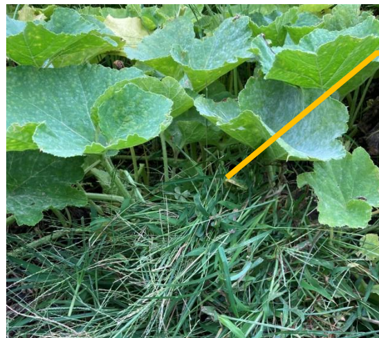
かぼちゃの ベッド

写真（左）はオクラの花。オクラは夏にぐんぐん大きくなるため、沢山収穫できる。あまり手はかからないが、収穫のタイミングを逃してしまうと直ぐに硬くなってしまう。