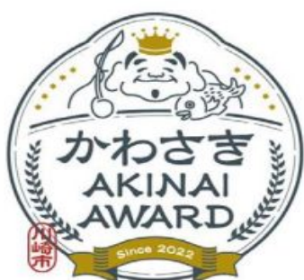
「かわさき AKINAI AWARD」 ロゴマーク

※4 令和5年度の川崎市商業者PR事業で作成したロゴマークやホームページ等を有効に活用するものとします。