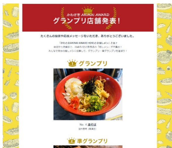
「かわさき AKINAI AWARD」 公式ホームページ