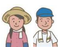
農地利用最適化推進委員