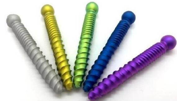
チタン部品の“視認性”を向上させる チタン陽極酸化