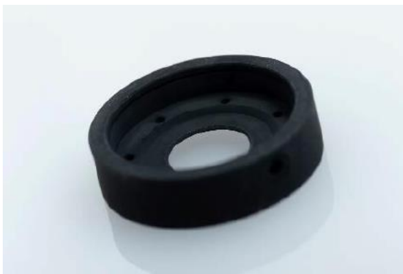
迷光を防ぐことにより、見たいものを“みえる化”する 黒色めっき「スゴクロ」