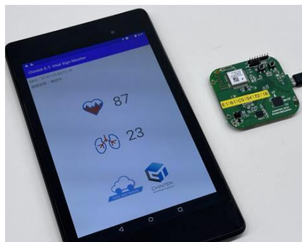
60GHz帯レーダーモジュールで、非接触による心拍数・呼吸数のモニタリングが可能