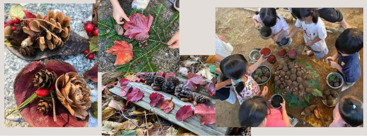
年齢 3歳児 季節 秋