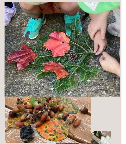
年齢 4歳児 季節 秋