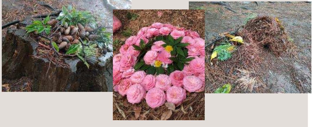
年齢 4歳児 季節 春