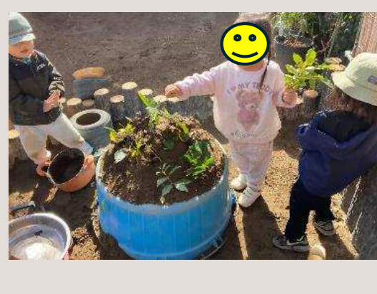
年齢 2歳児 季節 冬