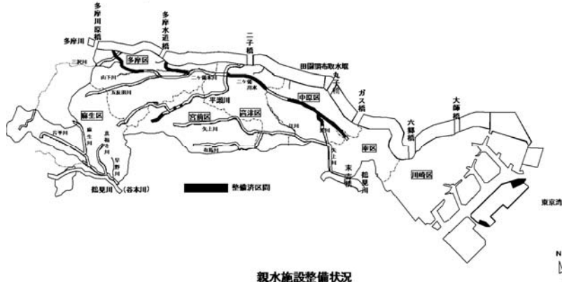
親水施設整備状況