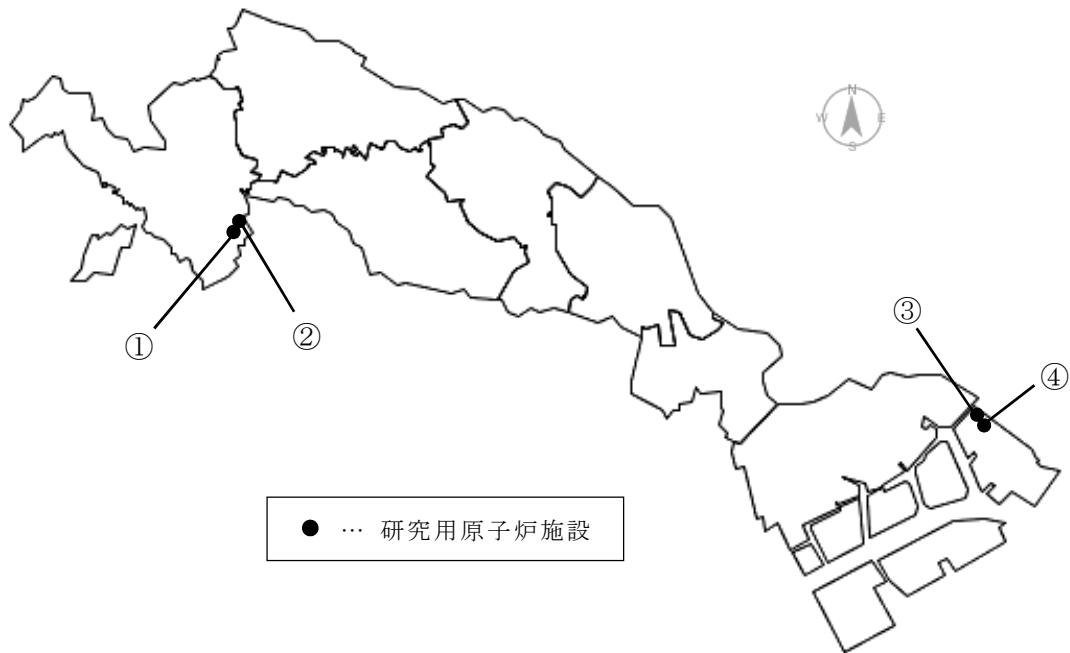
図 1 市内の研究用原子炉施設設置地点