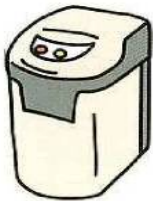
電動生ごみ処理機