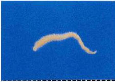
25シガンプラテンタキユレータ

【分 布】瀬戸内海、東京湾、松島湾、八代、水俣 【生息場所】沿岸の砂泥地 【大 き さ】体長 12～22mm 【備 考】体は扁平