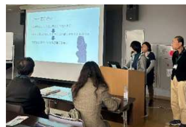
講座最終日の発表の様子

もともと環境問題に関心はありましたが、立場や年代の異なる方と意見を交わす中で環境への理解をより深めることができました。この講座でしか得られない人脈もたくさんできました。 今回の経験を通じて、コミュニケーションの大切さを実感したので、来年度は環境問題を議論する大学生のセミナーに参加する予定です。 (大学生：27期修了生)