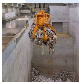
施設見学の様子（橋処理センター）