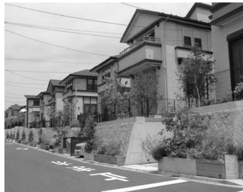
新百合山手都市景観形成地区

2007年度に屋外広告物の規制で除却した物件数は5,722件で、2000年度の約52,000件より46,278件減少しました。