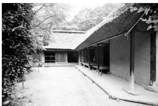
旧工藤家住宅（日本民家園）