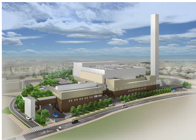
完成イメージパース図

大気、騒音、振動の項目については、環境保全目標に対して低い数値と予測され、緑については、環境保全目標の緑被率を上回る予測であり、景観については、地域景観の特性変化は少なく、周辺環境と調和の保たれた景観となるものと予測されていることなど、条例環境影響評価準備書の内容が確認されました。